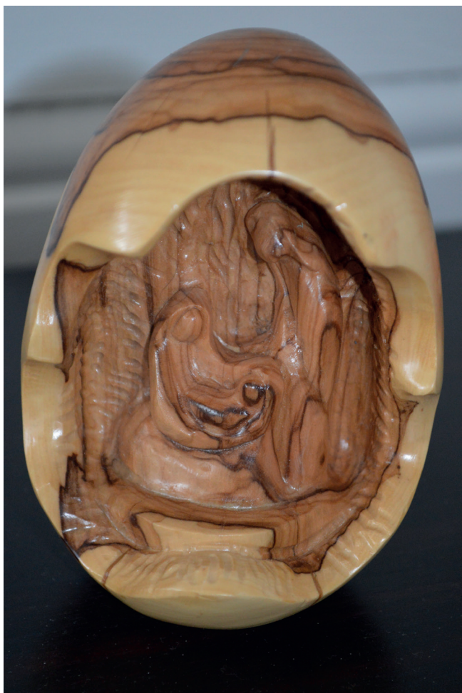
Lita julekrubbe frå Israel