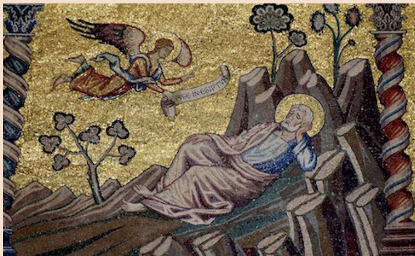
Josefs draum. Mosaikk i dåpskyrkja i Firenze. Maestro della Maddalena. 1300-talet.