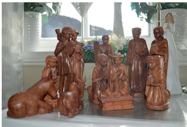
Julekrubbe frå Madagaskar