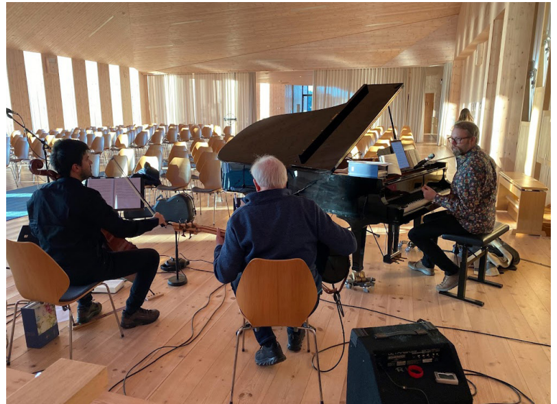
Spelar du eit instrument, eller likar du å synga? Denne gjengen er ein del av bandet som spelar til kveldsgudsteneste i Knarvik. Det er god plass til fleire!