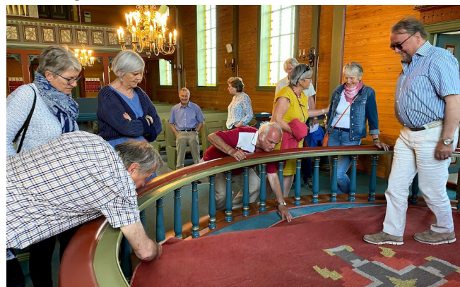
Ein god dugnadsgjeng gav i 2021 Alversund kyrkje ein liten oppussing innvendig. Maling og flikking - resultatet vart veldig bra! Kanskje har du lyst til å bli med i ei gruppe som jobbar med praktiske ting?