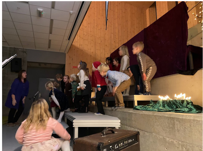
Knøttekoret hadde juleavslutning før jul. Det var konsert, song, bevegelsar og Shelly kom med godteposar til alle!