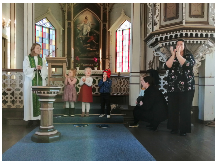
Familiegudsteneste med utdeling av 4-årsbok i Lygra kyrkje. Fin stemning, og borna var med på båtturn under preika, for då hørde vi om Jesus som gjekk på vatnet.