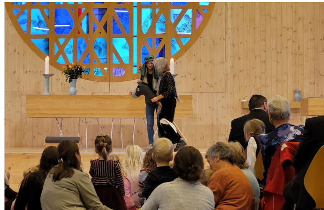
Kanskje vil du vera med som frivillig under gudstenester? Her er to som er med i dramatisering av ei preik, men du kan òg vera med og ønska folk velkomen når dei kjem, baka til kyrkjekaffi, lesa tekst under gudstenesta, styra powerpoint, eller andre ting.

Bli med ein tur inn i det frivillige arbeidet i soknet!