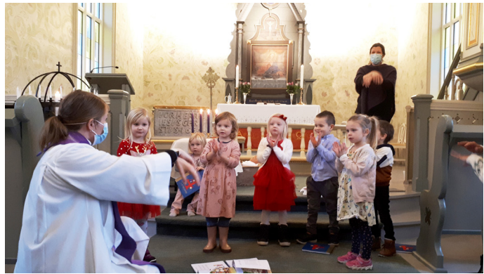
Glimt frå familiegudsteneste med utdeling av 4-årsbok i Seim kyrkje. Borna er med og gjer bevegelsar til «Kven har skapt alle blomane».