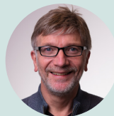
Odd Leif Mjøs