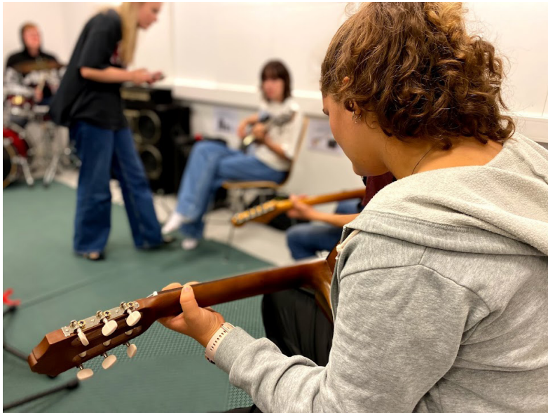
Rom for frivillige i barne- og ungdomsarbeidet vårt, som her, under Møteplassen.