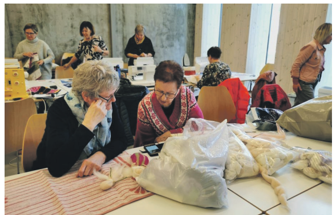
Djup konsentrasjon og triveleg prat under produksjonsdagen før julemessa. Det er kjekt å jobba saman mot eit felles mål.

å få bidra i arbeidet. Det er rom for mange forskjellige folk – og plass til ulike bidrag. Det trengs folk på kjøken, praktisk arbeid, salg av årer, gje gevinstar, laga ting til sals, ha aktivitetar for borna, og mykje meir.