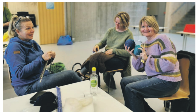
God stemning, prat og jobbing står på agendaen når NMS arrangerer produksjonsdagar før julemessa.