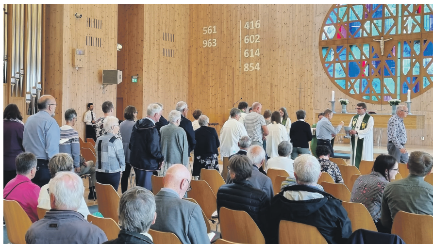
Nattverd: Eit godt frammøte til denne gudstenesta.