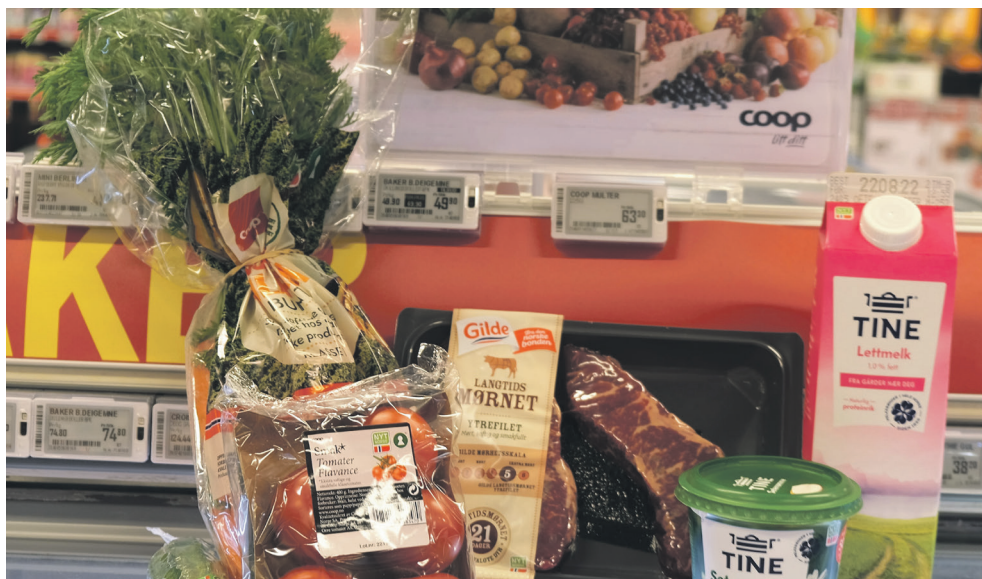
Nyt Norge-merket tyder friske plantar, god dyrevelferd og trygg og relativt kortreist mat.

Så det var nokre utfordringar som dukka opp – den største var nok at det var dårleg med Fairtrade og Nyt Norge-merking på sjokolade... - men mest av alt har dette vore ei positiv utfordring for meg og kva eg tenkjer gjennom når eg handlar mat. For det er overraskande mange gode produkt