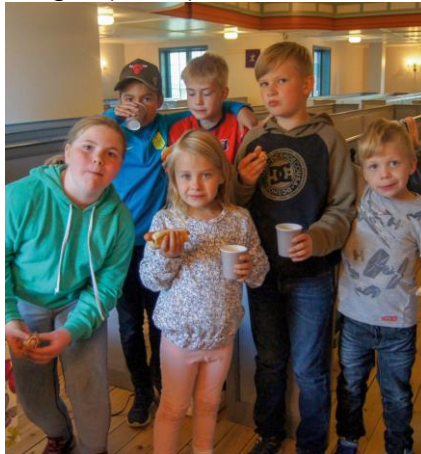
Tema: Å være ein ven