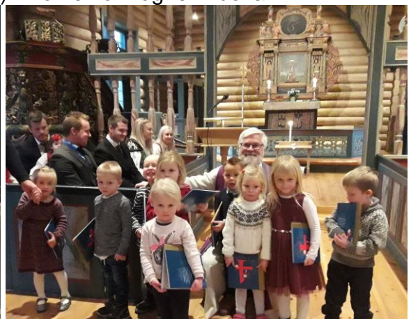
4-åringar i Dovre kyrkje