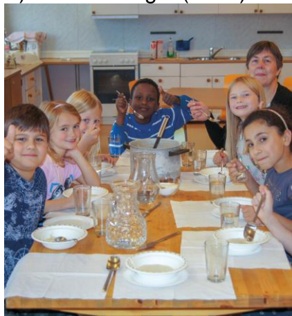
Velling og poteter smaker godt!