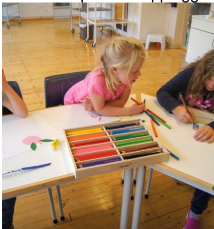
Lager bilde av alt vi kan eta