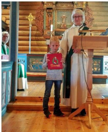
6-åringane har fått bok