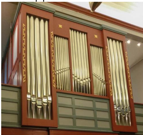
Ny, flott orgelfasade

Orgelet i Dombås kyrkje har 1050 klingande piper, fordelt på 20 stemmer. Det har to manualar (håndklaviatur) og pedal (-klaviatur), mekanisk traktur (forbindelsen tangent-pipe) og elektrisk, prosessstyrt registratur (stemmevalg). Fasade, orgelhus og spelepult er utforma av Lennart Olofsgård, som også har gjennomført intonasjonen (den klanglege tilpassinga) av kvar einskild pipe.