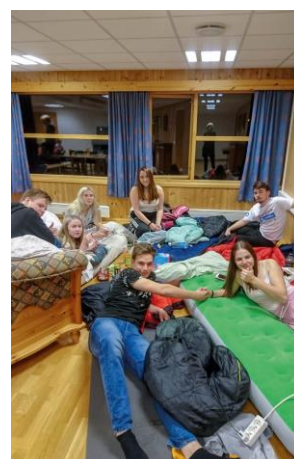
Leiarhelg i oktober