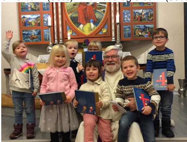
4-åringar i Dombås kyrkje