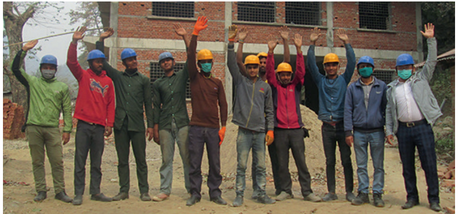
Byggegjeng framfor skolebygg for byggfag.

Her kommer HimalPartner sitt prosjekt inn. Prosjektet er støttet av NORAD, og HimalPartner samarbeider med BTI (Butwal Technical Institute) i Nepal og Knarvik Vidaregåande skule. BTI er en