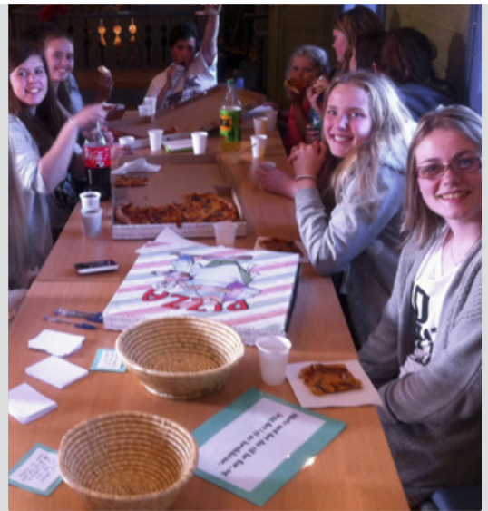
Frå overnatting i Blomvåg kyrkje.