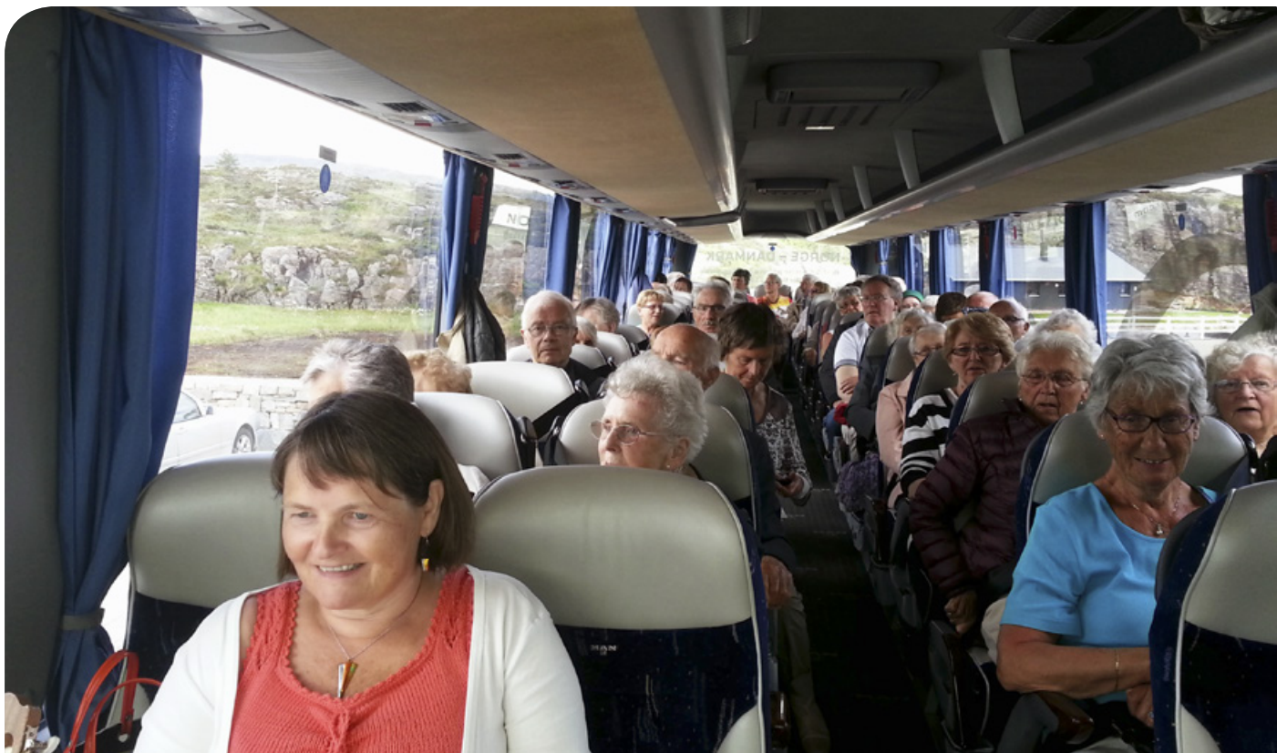
Ein flott gjeng på tur