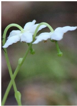
Blomsten Olavsstake

Når våren står på sitt aller fineste vandrer vi langs pilegrimsleden fra historiske Halden nordover gjennom vakre kulturlandskap rikt på fornminner. Langs ruten ligger middelalderkirkene som perler på en snor og tilbyr påfyll for vandrere og tilknytning til pilegrimer fra gammel tid. Vi krysser Europas største foss og kommer inn i byen som Olav den hellige grunnla for 1000 år siden, Sarpsborg. Derfra går pilegrimsleden videre nordover raet via Tune, Galleri Soli Brug til landbruksbygdene Råde og Rygge, også de med rikt utsmykkede middelalderkirker.