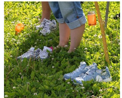
Rast i vårsolen.