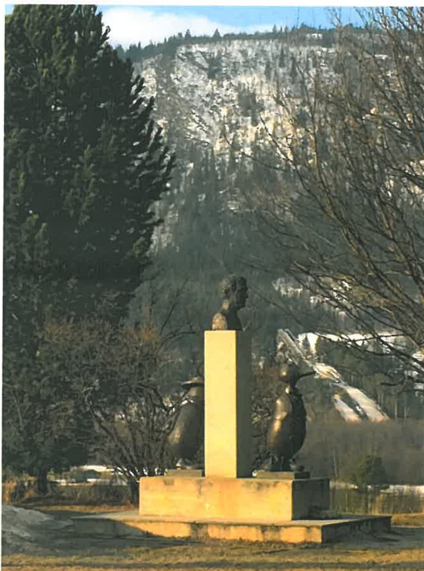
Nils Aas' monument over Kjell Aukrust i Alvdal.