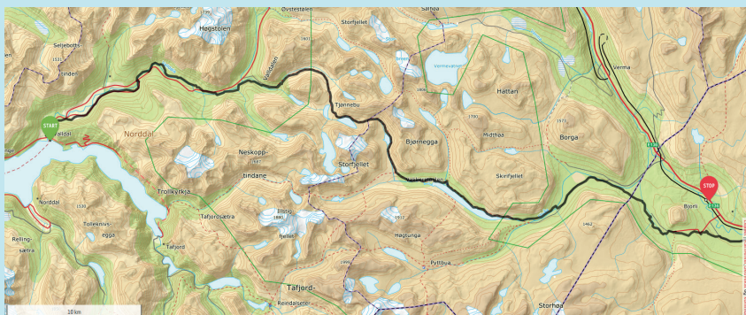
Valldalsleia (svart), og våre stopp- og startsdater.

Avslutning av pilegrimsturen etter frukost.