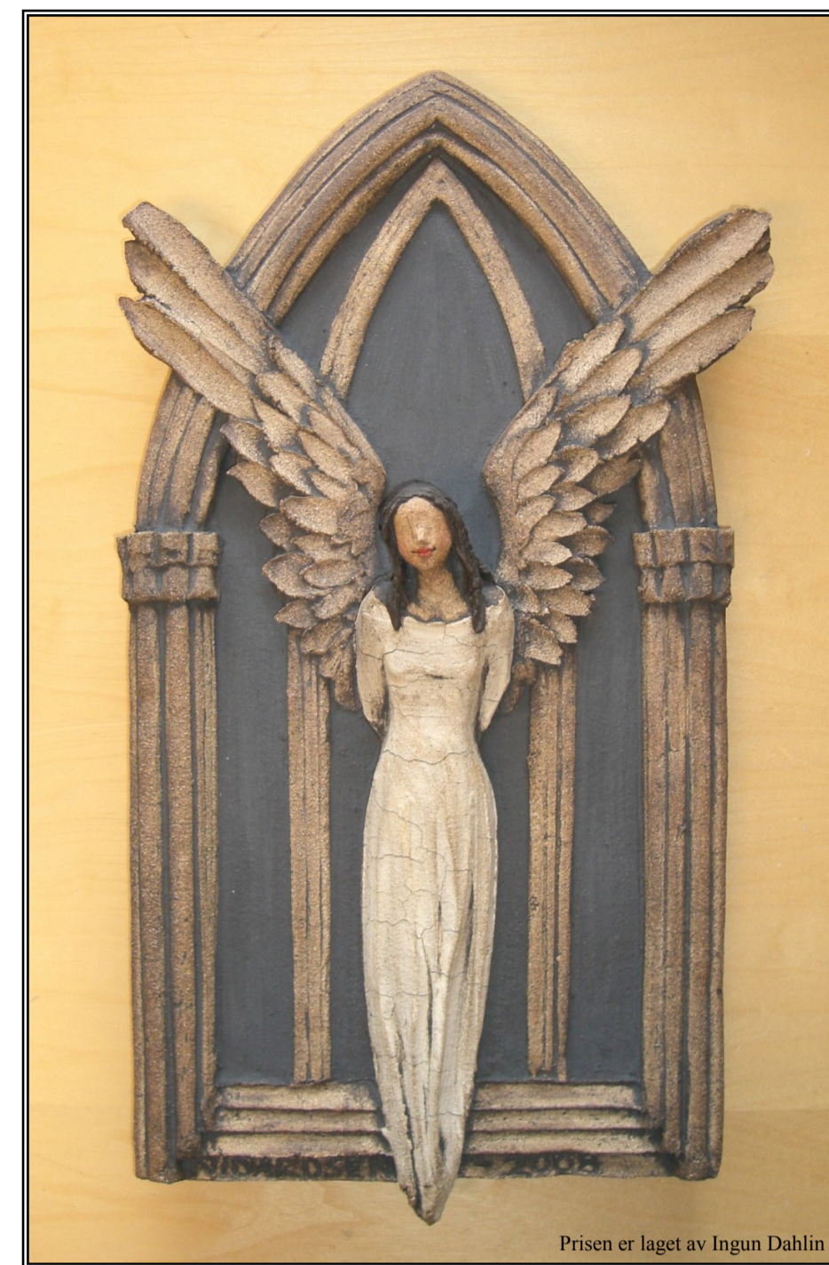
Prisen er laget av Ingun Dahlin

Nidaros bispedømmeråds hederspris, opprettet i 2002: