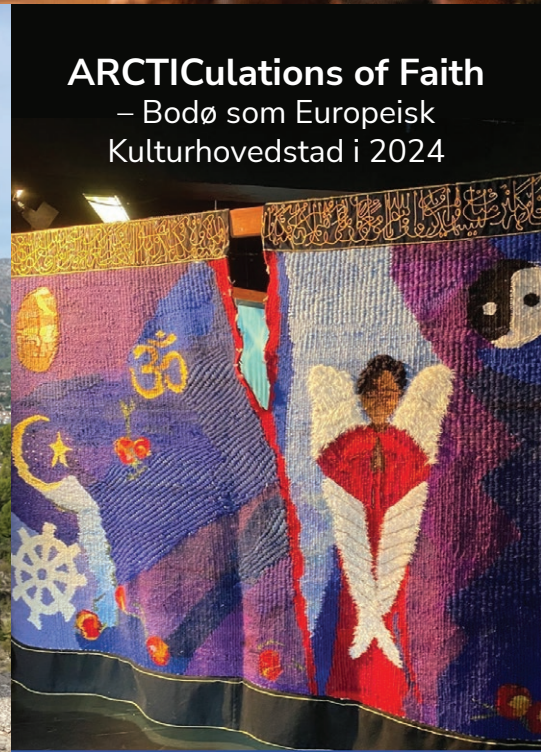
ARCTICulations of Faith – Bodø som Europeisk Kulturhovedstad i 2024