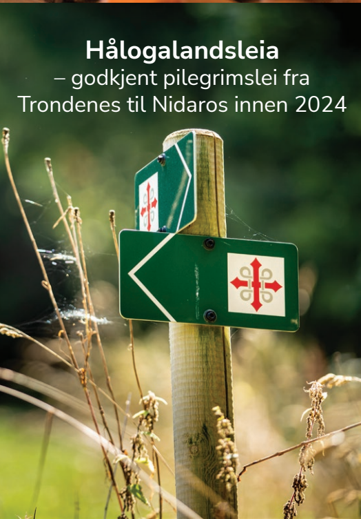
Hålogalandsleia – godkjent pilegrimslei fra Trondenes til Nidaros innen 2024