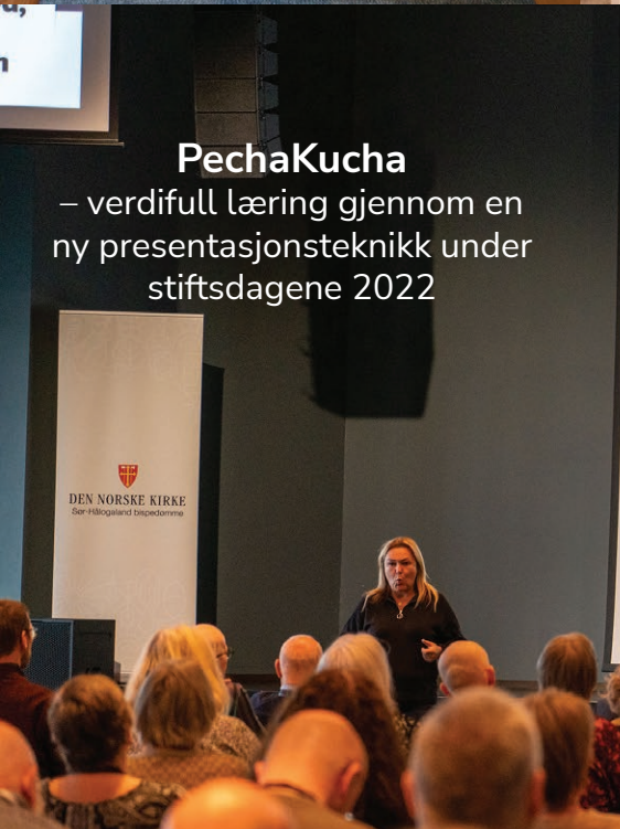
PechaKucha – verdifull læring gjennom en ny presentasjonsteknikk under stiftsdagene 2022