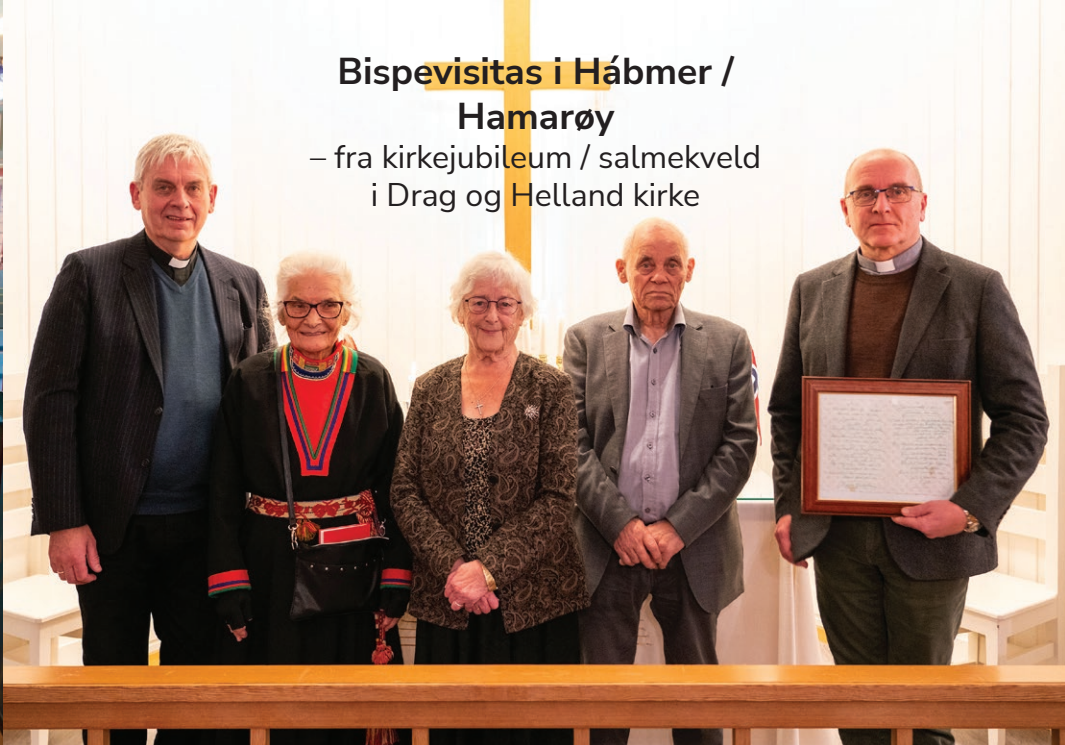
Bispevisitas i Hábmer / Hamarøy – fra kirkejubileum / salmekveld i Drag og Helland kirke