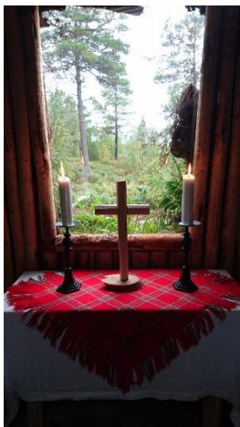
Foto: Alteret i kirkegammen på Drag

Samefolkets dag 6. februar, er blitt en tydelig markør av samefolkets kulturelle og historiske bevissthet. Flere menigheter er med i lokale markeringer, da ofte med gudstjeneste. Det er avholdt større arrangementer i Tysfjord, Hamarøy og Bodø. Vi ser at stadig flere menigheter markerer Samefolkets dag på tilliggende søndagsgudstjeneste. Dette har vært en god mulighet for menighetene til å ta i bruk samisk språk og kulturuttrykk i gudstjenesten, og kan forhåpentligvis styrke bevisstheten om å bruke samiske liturgiledd i gudstjenesten. Bevisstheten øker om at det fins materiell også til bruk i andre kirkelige sammenhenger.