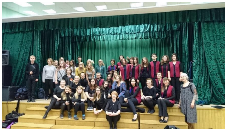
Foto: Ungdommer fra Norge og Russland på SKKBs ungdomskorfestival på Kolahalvøya.

Sør- Hålogaland bispedømmeråd er medlem i Samarbeidsrådet for Kristne Kirker i Barentsregionen (SKKB). Dette er det eneste formelle samarbeidet Den norske kirke har med kirkene i Russland. I tider med innstramminger i forhold til samarbeid med Russland på det politiske plan, gis det fortsatt statlig støtte til folk-til-folk samarbeid. SKKB hadde i 2016 20 års jubileum med stor ungdomskorfestival på Kolahalvøya. Her deltok Sør-Hålogaland med 8 ungdommer som var med som kornedlemmer fra Norge sammen med Nord-Hålogaland.