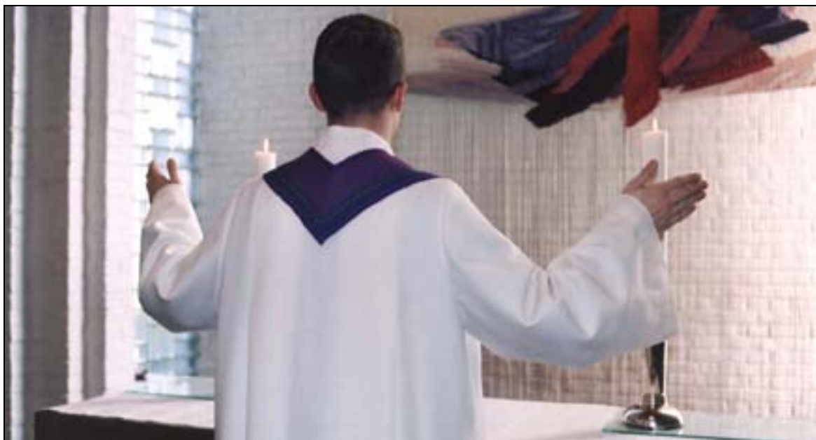
En alba har stor ermevidde og dype folder i ryggen