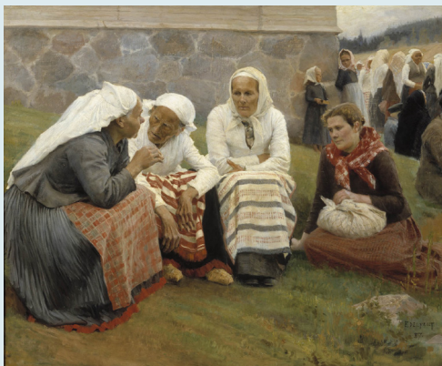
Måleri av kvinner utanfor kyrkje i Finland. Albert Edelfelt, 1887. Fri bruk, Wikimedia Commons.

Dette og meir til leitar vi etter svar på når vi samlast i Bø i november.