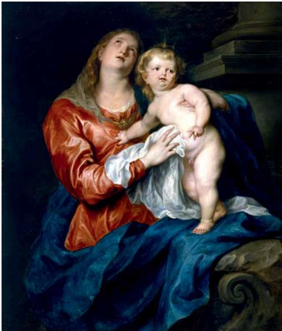
Maria og Jesusbarnet malt av den flamske maleren Anton van Dyck (1599-1641).