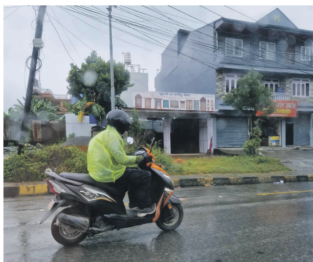
Regnvær i Pokhara