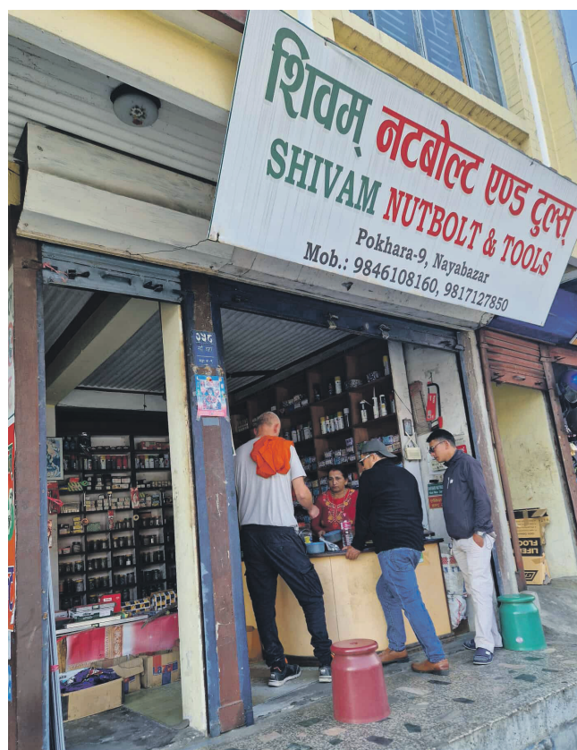
Butikk med skruer og mutre