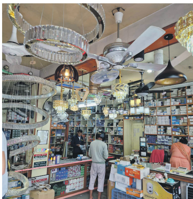
Lokal butikk med lamper og elektriske komponenter