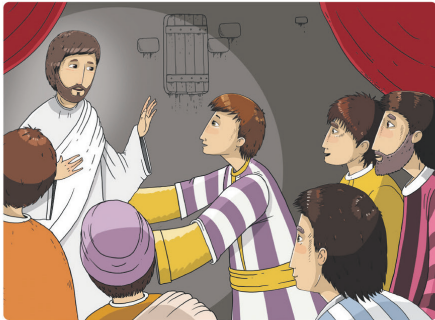
Teikning: Aleksei Bitskof

Desse to bilda er nesten heilt like. Greier du å finne 5 feil på bildet under?