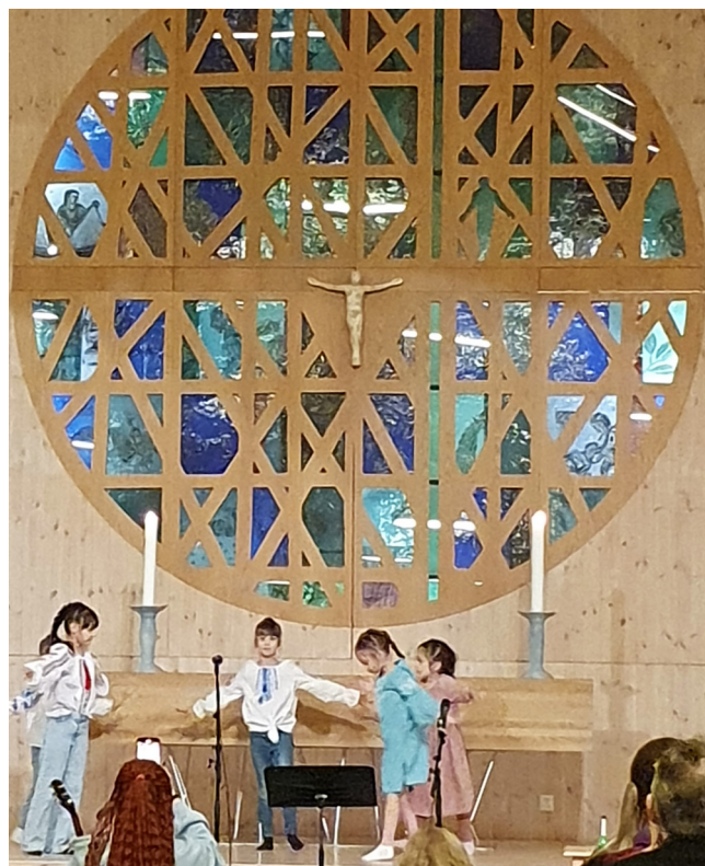
Nesten ingen tørre auge i salen når dei ukrainske jentene dansa til ære for heimlandet sitt.