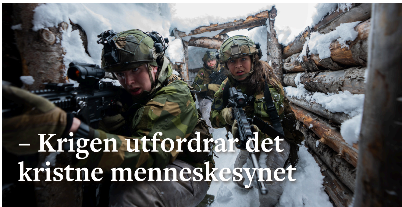
“Klar til strid”