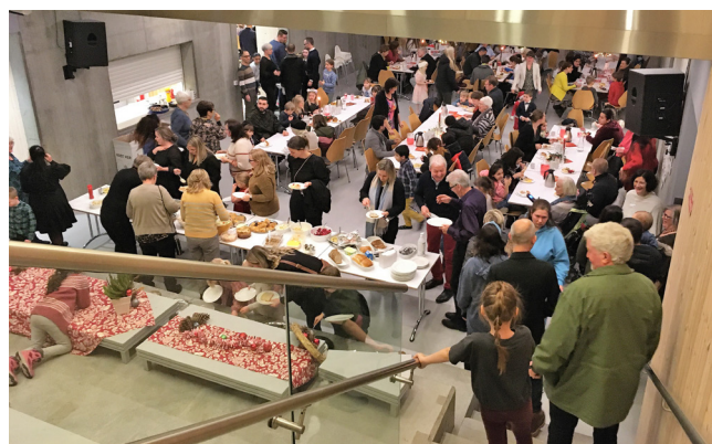
Flott matbord og mange å mette.