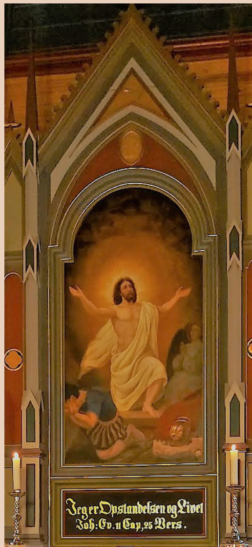
Altartavla i Alversund kyrkje