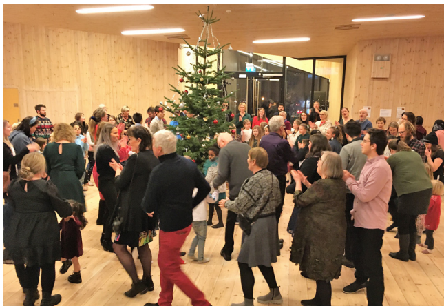
Julettregang med fleire ringar.