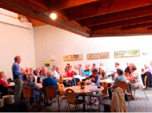
Fra årets sommertur med Åpent hus.