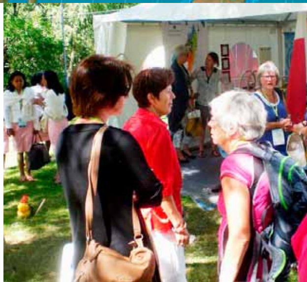
Fra Det norske misjonsselskap sin generalforsamling og sommerfest på Ekeberg i Oslo.

http://www.ravinala.no/vest-etiopia-november-2014/category2610.html