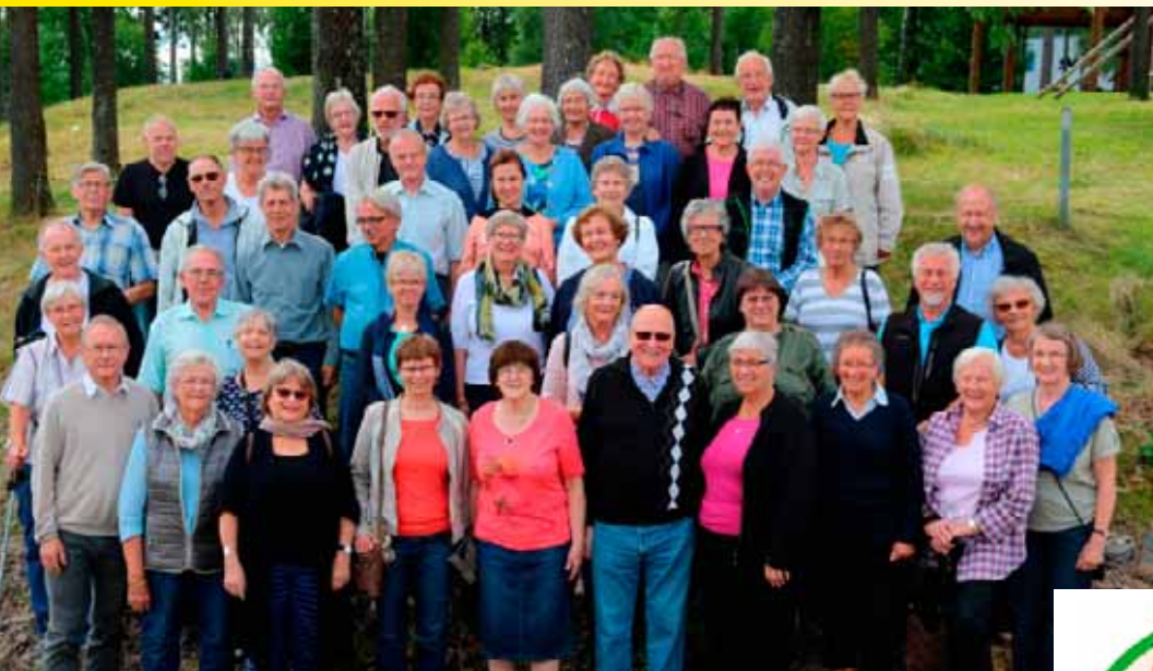
Deltakerne på årets menighetstur.