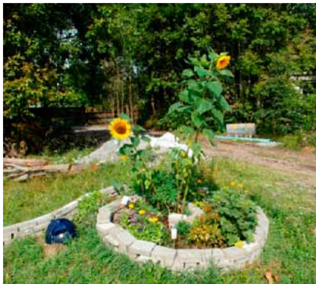
Pirathage og tre ved Raveien.