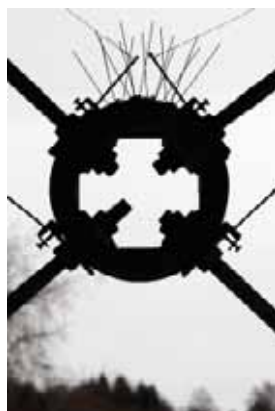
Løsning på forrige oppgave: en detalj på gangbroen over jernbanen på Ås stasjon.