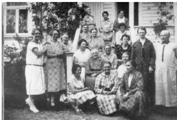
Ås sjømannsmisjon i 1920-årene.