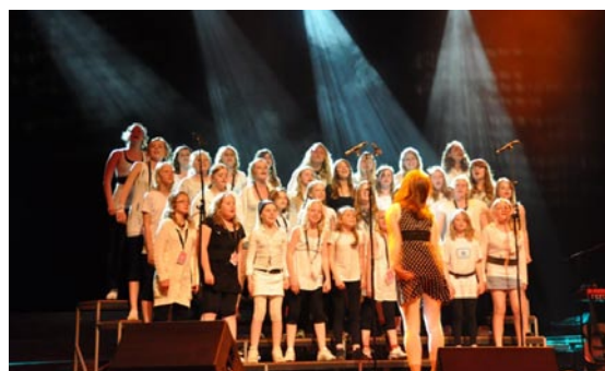
Ås og Hadeland Soul Children opptrådte sammen, en stor opplevelse!