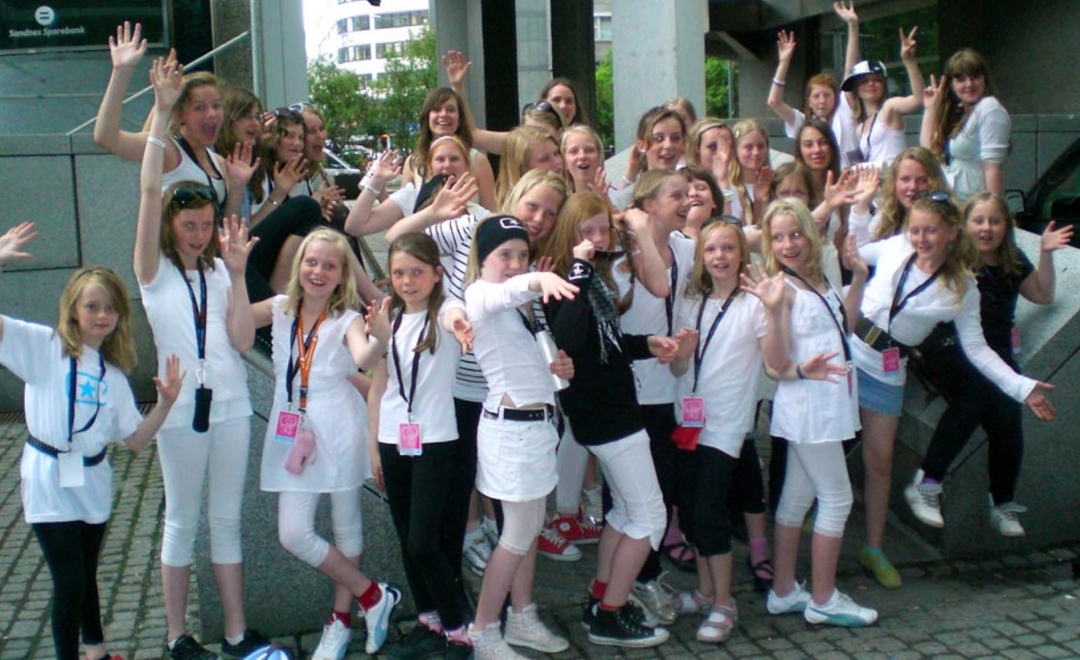
Hadeland og Ås Soul Children har samme dirigent og ble godt kjent i pinsehelgen.