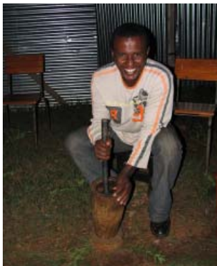
Samson stamper kaffibønner.

Dei to fyrste vekene av juli var alle i programmet vårt samla i byen Gimbi for halvårsrapportering og budsjettrevisjon av dei NORAD-finansierte prosjekta til NMS. Det blir mange og lange dagar rundt langbordet og framfor PC-skjermene ved