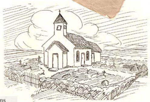
Aas gamle Kirke.

Ikke alt er «tøv og tant». Noe er ganske sikkert sant: Det står at kirken ble innviet 6. oktober, men intet årstall. Andre kilder sier at året var 1170 og at den ble oppført i granitt av tilhuggede firkantede steinblokker, og at den, i sin tid, var Follo's største steinkirke. Det stemmer nok også at Åsmåsan var en innsjø, men ligger det en stor kirkeklokke der?