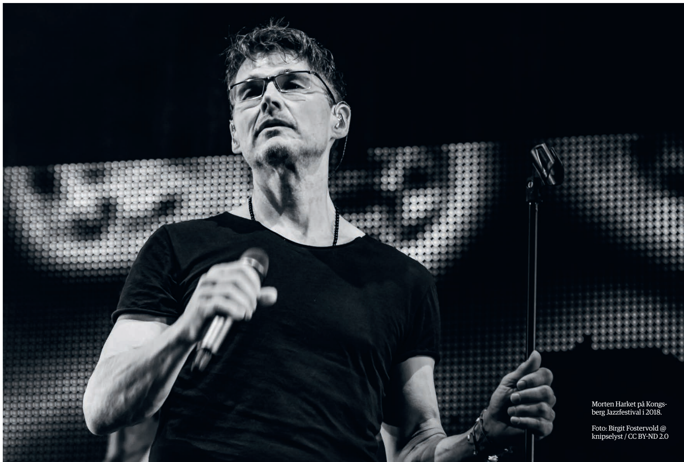
Morten Harket på Kongsberg Jazzfestival i 2018.