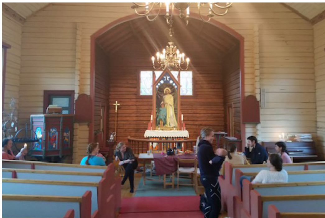
Fra babysang i Filtvet kirke denne høsten.

Første søndag i advent markerer starten på et nytt kirkeår og det vil vi feire! I Kongsdelene kirke inviteres 11-åringene til Lys våken. Lys våken er blitt en god tradisjon i kirken. Lys våken handler om at vi skal være våkne overfor det som skjer i oss og rundt oss. Gjennom lek, sang, aktiviteter og kreativitet vil 11-åringene få kunnskap om advent, bli kjent med hverandre