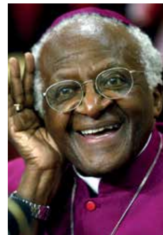
Desmond Tutu.