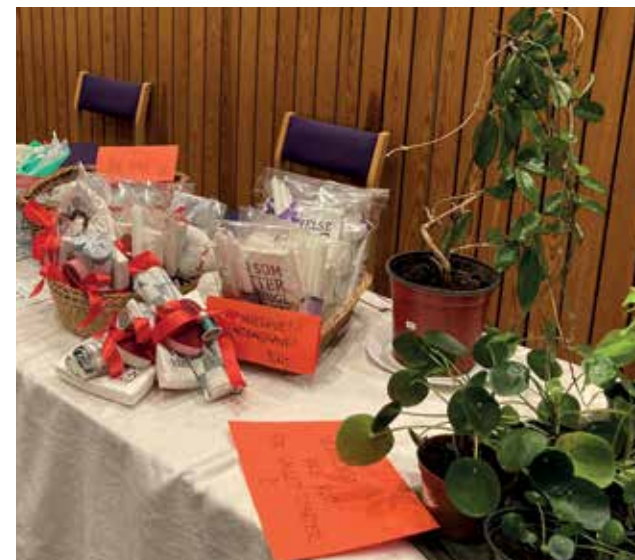
FØRJULSMARKED: Sett av lørdag 12. november til en hyggelig dag i kirken vår.