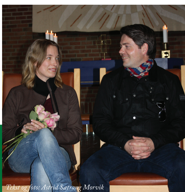
Tekst og foto: Astrid Sætrang Morvik

Les mer om kirkens mange aktiviteter på vår hjemmeside: www.ostenstadkirke.no I denne spalten vil vi presentere én aktivitet hver gang. Denne gangen presenterer vi: