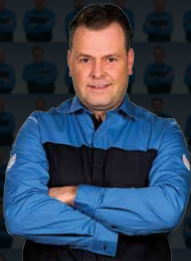
Rune Austrheim Fosløy Bilcenter AS

Til sammen har vi 3 815 års erfaring med bilservice i Norge.