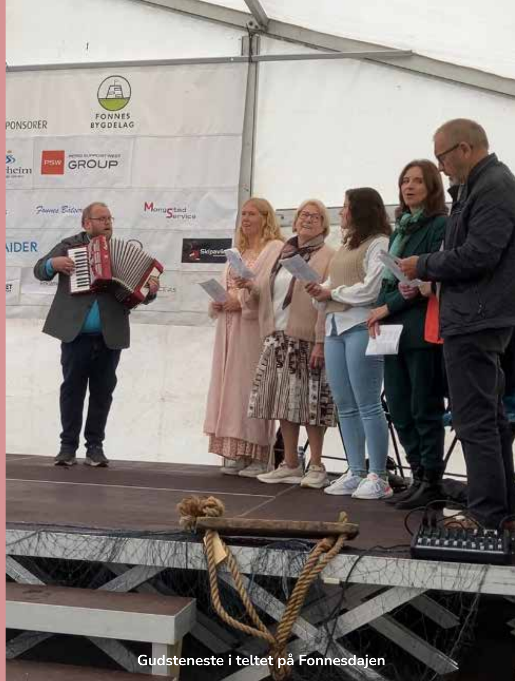
Gudsteneste i teltet på Fonnesdajen

Kyrkjebakken nr. 6 – 2024 – augustnummeret – årgang 53- Nytt stoff innan 14.september