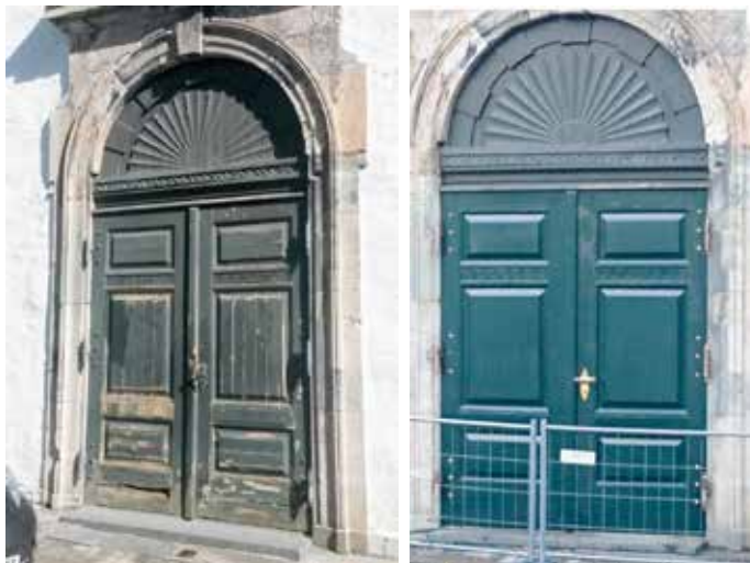
Nykirkens dør mot gaten, før og etter oppussing.

Dessverre har vi et stort vedlikeholdsetterslep på kirkedørene våre. I 2016 gjorde vi en kartlegging av alle dørene, og bestemte oss for en høyere prioritering av vedlikeholdet av disse. Ettersom noen av dørene må totalrenoveres, vil det ta noe tid før vedlikeholdsetterslepet er tatt igjen.