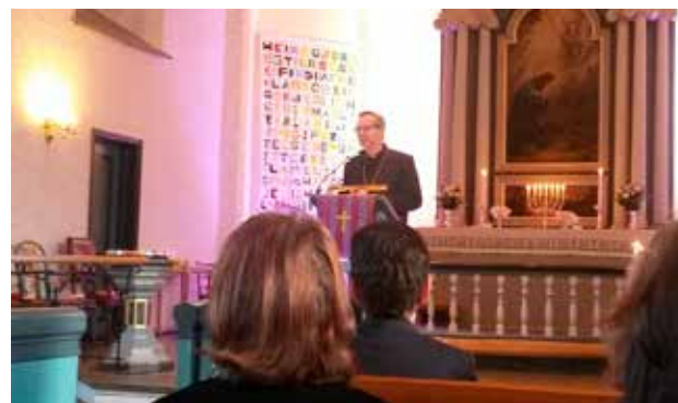
Arna og Ytre Arna, visitasforedrag: Biskopen ga menighetene ros og utfordringer.

Bergen kirkelig fellesråd lever stoff til visitasmeldingen som beskriver de oppgavene fellesrådet har ansvar for, og deltar i møter og gudstjenester under visitasene.