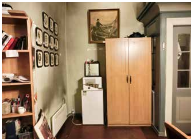
Prestesakristi/kontor Nykirken, før og etter oppussing.

Sent på våren 2016 fikk vi melding om uforsvarlig høye radonnivåer i Fyllingsdalen kirke, spesielt i kjelleren. Kjelleren ble straks stengt for bruk. Vi leide inn radon- og ventilasjonskonsulenter. Gjennom sommeren ble det gjort ytterligere