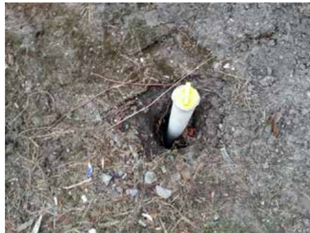
Miljøbrønner er satt ned for at vi skal overvåke grunnvannsforholdene.