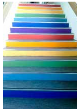
En kirketrapp for barn kan med fordel være fargerik.

Landås kirke hadde 50-årsjubileum i 2016. I forkant av jubileet ble kjelleren med lekerom for barna oppgradert, blant annet med varmepumpe som ny oppvarmingsløsning. Dessuten ble det bygget ny vegg mellom kirkerom og menighetssal, alteret og korpartiet ble oppgradert, og kirken fikk ny kirkeløper. Utenfor kirken ble dreneringen forbedret.