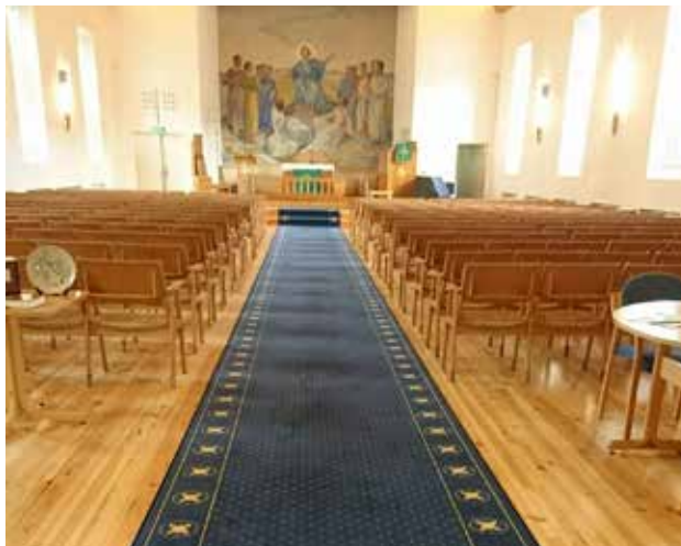
Nyslipt gulv og ny løper i Solheim kirke

Ytre Arna kirke: nytt skinn alterring og stoler, nytt jordfestingsutstyr