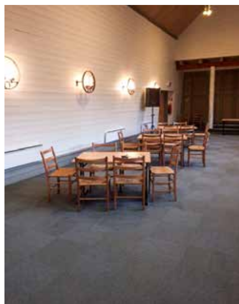
Nymalt vegg og nytt teppe i kapellsalen, Fana menighetssenter.