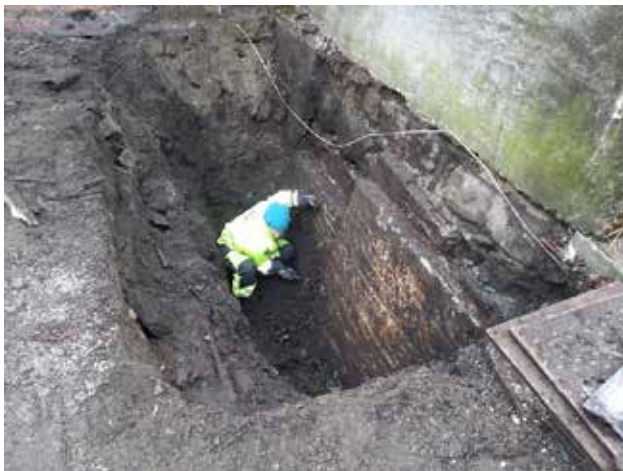
Arkeologer har gravd seg ned til trefundamentene under Korskirken.