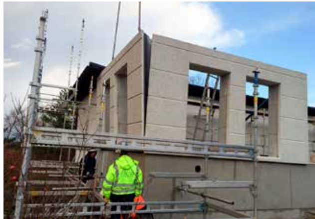
Olsvik kirkekontor: Veggelementer heises på plass.