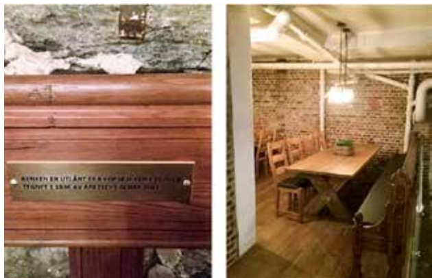
Overflødige kirkebenker fra Korskirken har fått nytt liv.

Korskirken: Overflødige kirkebenker har fått nytt liv på et utested i kirkens naboskap, utlånt etter avtale med Riksantikvaren. Tidligere har disse etter statlig pålegg stått bortgjemt på et dårlig lager.