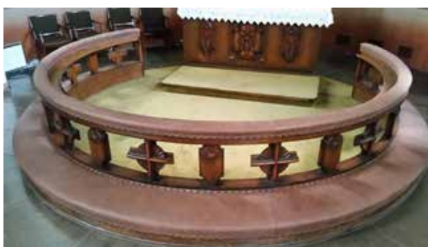
Nytt skinn på alterringen i St. Markus.