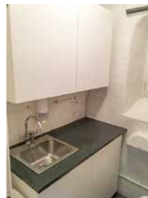
Salhus kirke sakristi – før og etter oppussing.