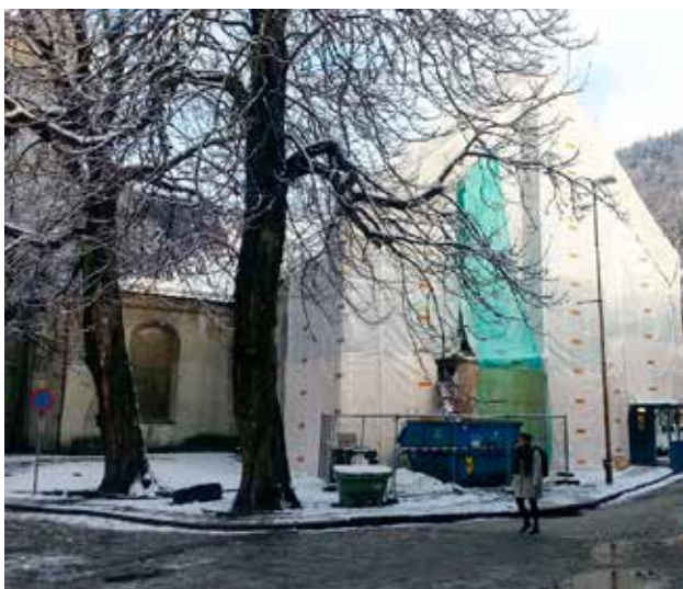
Søndre gavlvegg er rehabilitert, sementpuss er hogget ned og erstattet med kalkpuss.

Endeveggen på søndre korsarm var i svært dårlig forfatning, og murpuss falt ned på fortauet og var til fare for forbipasserende. Vi har nå hugget ned all gammel murpuss og erstattet denne med kalkpuss. I tillegg har vi rehabilitert vinduer i denne veggen.