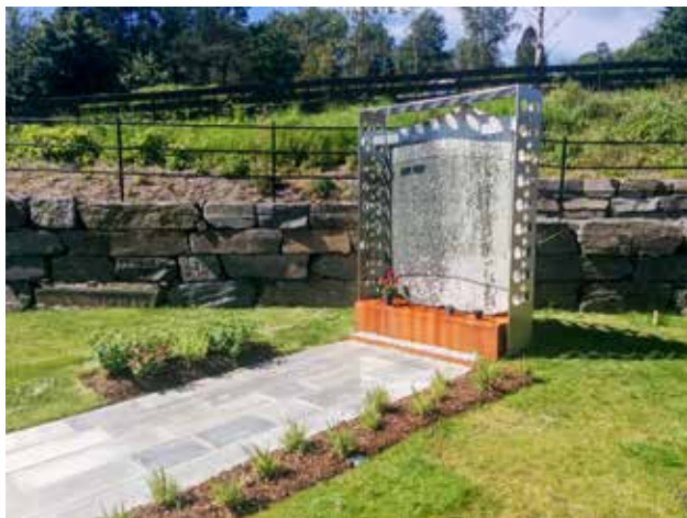
Navnet minnelund i Åsane

Vi har laget en tradisjon av å invitere til Åpent hus på Møllendal kapeller og krematorium på vårparten. Lørdag 23. april stilte medarbeidere fra Gravplassmyndigheten og krematoriet opp med foredrag og omvisninger, noe som ble godt mottatt av de som besøkte oss. Fortsatt er det ikke så veldig mange som møter opp, men vi opplever at tilbudet settes svært stort pris på av de fremmøtte.