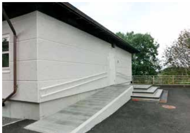
Olsvik kirkekontor: Vanskelig å se forskjell på gammel og ny vegg.