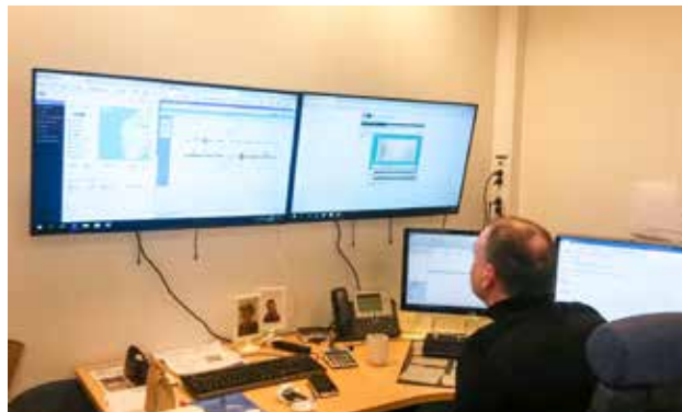
Operatøren følger med på strømforbruk i de ulike kirkene.

BKF ønsker å ta vårt miljøansvar på alvor, blant annet gjennom å tenke energiøkonomi i kirkene våre. Ved siden av styringen av det nye varmeanlegget i