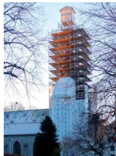
Rehabilitering av tårnet i Sandvikskirken.