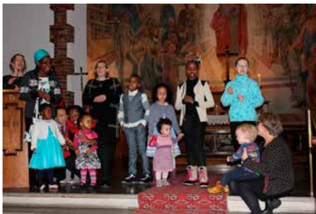
Løvstakksiden: Barn, unge og voksne fra mange ulike nasjoner deltok i visitasgudstjenesten