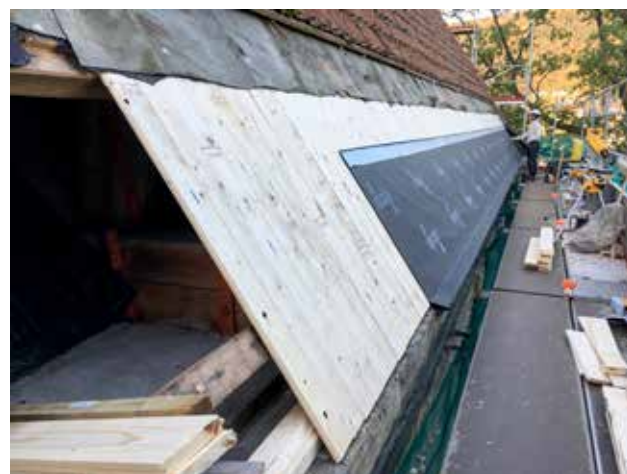
Storetveit kirke: skifting av tak.

I økonomiplanen for BKF var det satt av penger til skifting av taket på Storetveit kirke i 2017. I forbindelse med reparasjon av stormskader på taket i kirken vinteren 2016, kom det frem at det ville være en stor risiko forbundet med å vente så lenge med dette, både besøkende i kirken og besøkende på kirkegården ville kunne risikere å få takstein i hodet. Prosjektet ble fremskyndet og startet opp august 2016. Takarbeidet pågikk hele høsten, og ble fullført vinteren 2017. På nordsiden av kirken var det store råteskader i taket grunnet fuktighet som kom fra