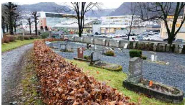
Under omreguleringsarbeidet SO.D10

I 2016 fortsatte vi vårt fokus på kvalitetssikring av gravregisteret, i «Prosjekt Frigjøring av areal». Spesielt fokus har det vært på feltene på Solheim, langs Fjøsangerveien. Det har vært tett oppfølging av selve arbeidet i samarbeid med Akasia, og vi har vært spesielt oppmerksomme på informasjon og dialog med berørte festere.