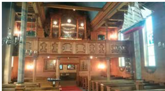
Nytt orgel i Laksevåg kirke.