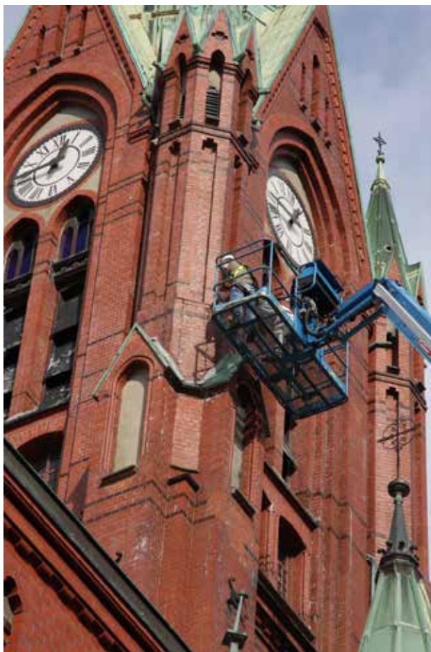
Nødreparasjon av Johanneskirken.

Prestesakristiet i Nykirken ble også totalrenovert, med maling og ny innredning.