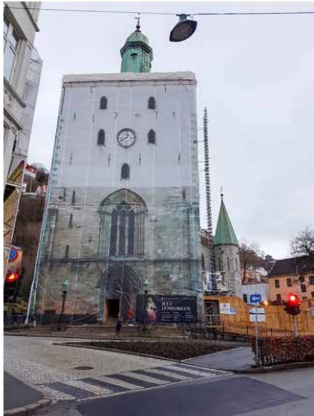
Domkirkens tårn pakket inn i stillas med duk for å rehabiliteres

Mens deler av arbeidet har gått raskere enn forventet, har det vist seg at kvadersteinene har noe større skade enn forventet. Hva dette vil bety i prosjektet vil vi få avdekket i 2017/2018. Vi har imidlertid tro på at den totale prosjektkostnaden for rehabilitering av Korskirken og Domkirken ikke vil bli dyrere enn tidligere antatt.