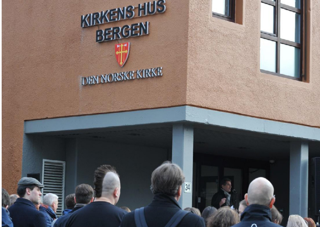
Det nye Kirkens hus Bergen i Marken 34 på åpningsdagen i mars.