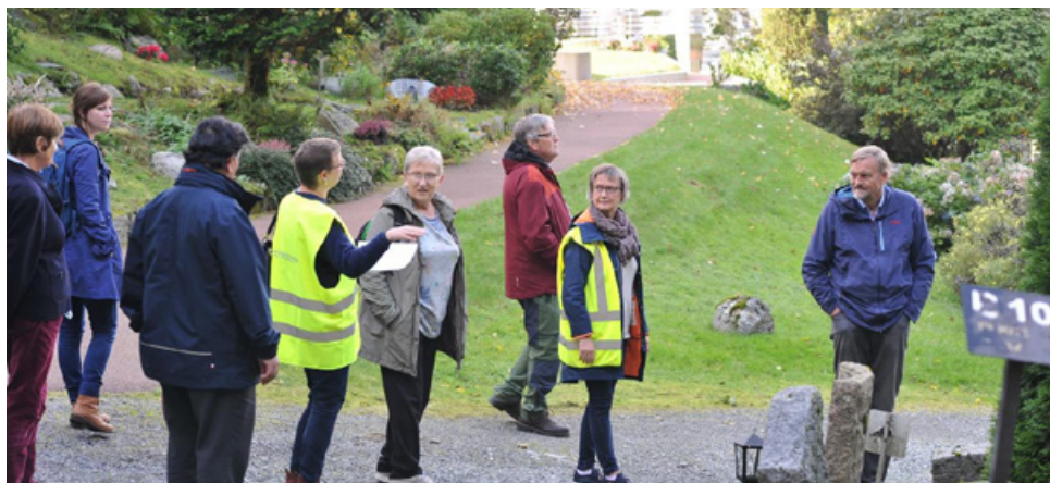
Gravplassutvalget på befaring på Storetveit kirkegård.