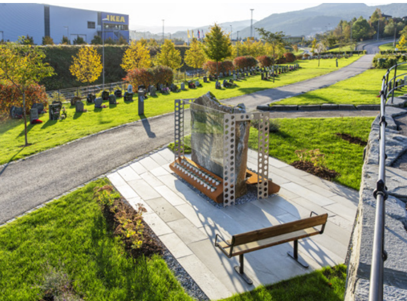
Det nye minnesmerket på Åsane kirkegård.

Året har vært preget av at det største gravplassprosjekt i BKF's nyere historie, anleg-