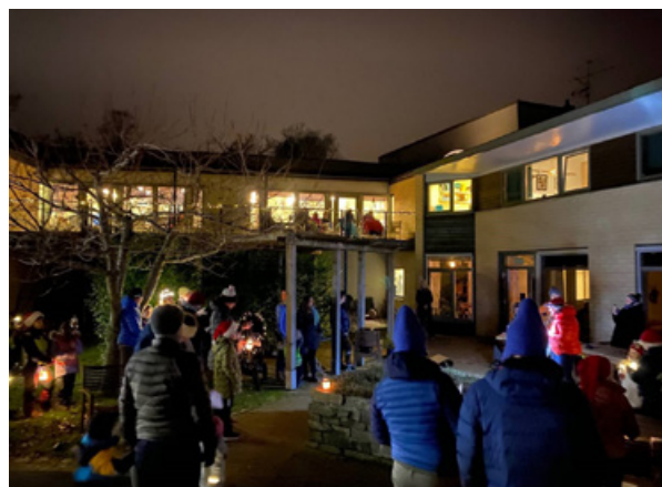
«Vindukonsert» på Mildeheimen sykehjem på Luciadagen.