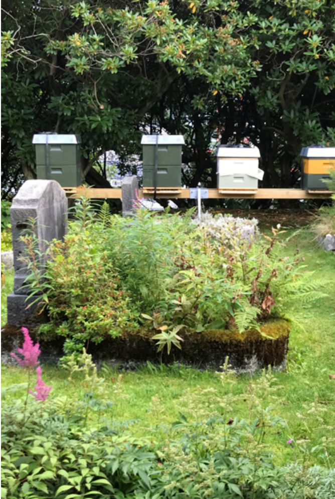
På Møllendal er det blitt satt opp bikuber på gravplassen.