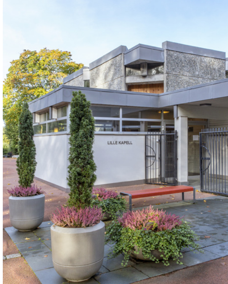
Møllendal kapell.

På Møllendal krematorium er begge ovner rehabilitert. En ovn er bygget om for å kunne ta imot større kister.