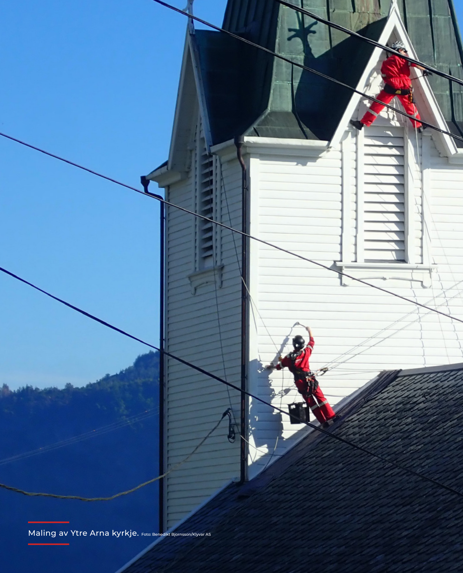
Maling av Ytre Arna kyrkje.