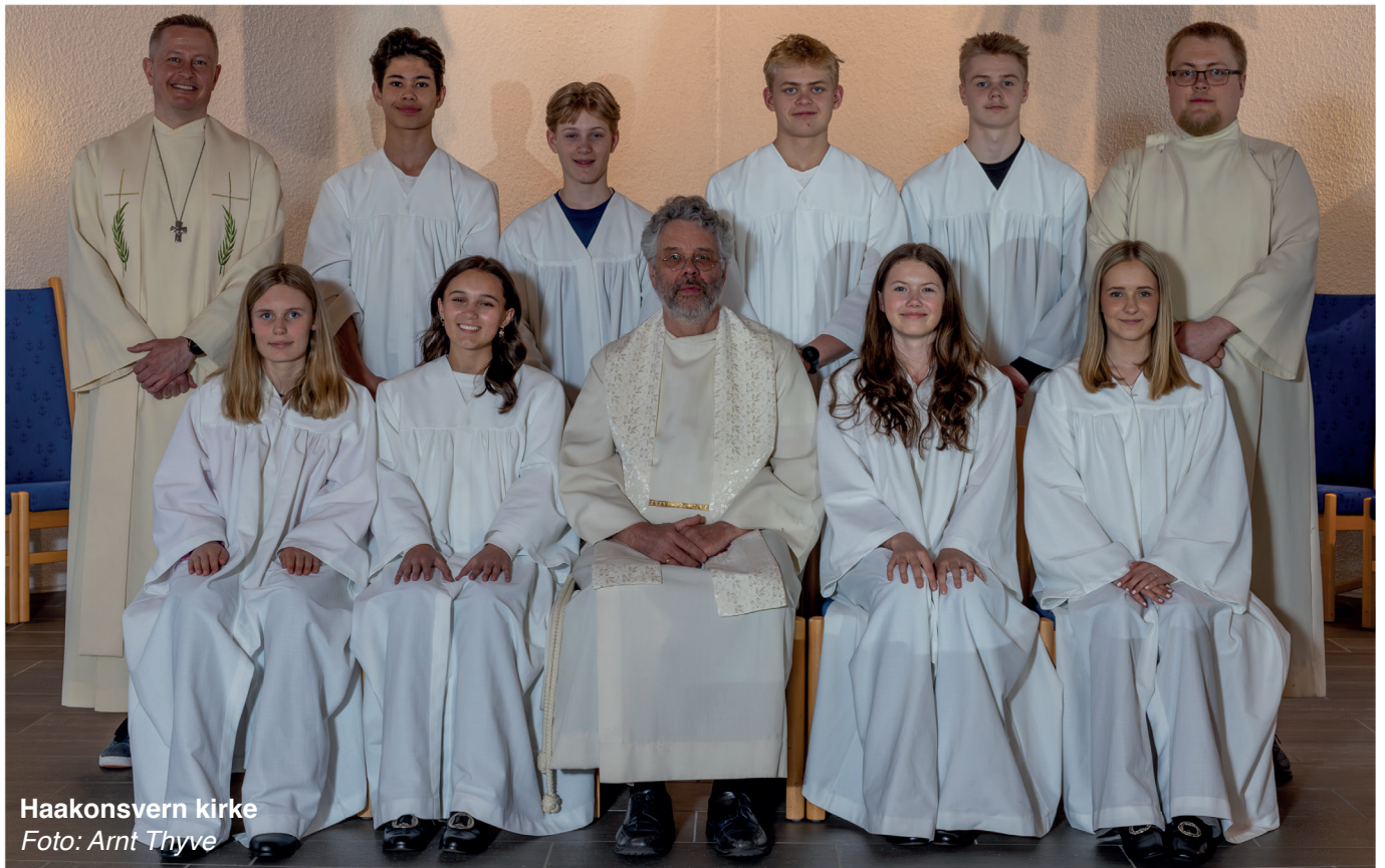
Haakonsværn kirke