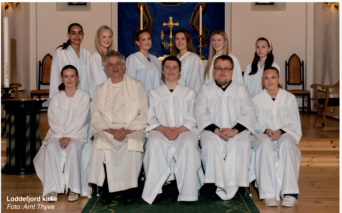
Loddefjord kirke