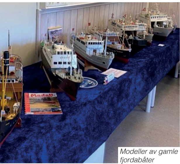
Modeller av gamle fjordabåter

Modeller av 'Kiel-båtene', som alle ble ombygget fra skroget til 5 marinefartøy, til passasjertrafikk langs-norskekysten etter krigen. Rolf Hatland i bakgrunnen.