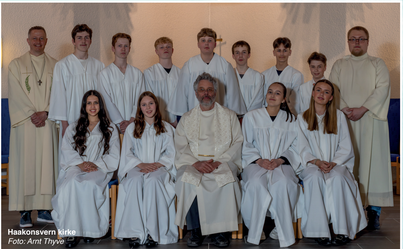
Haakonsvern kirke