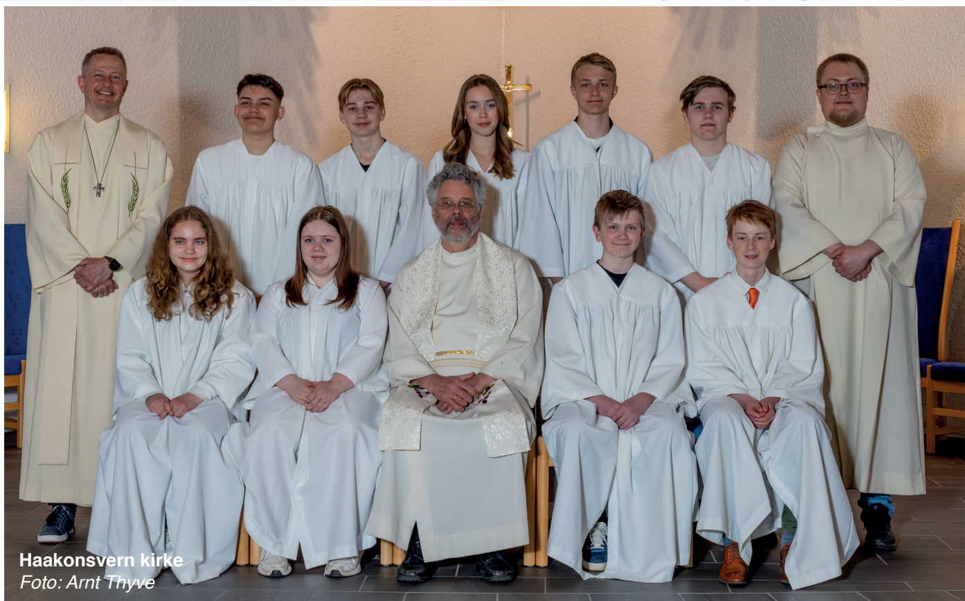
Haakonsvern kirke