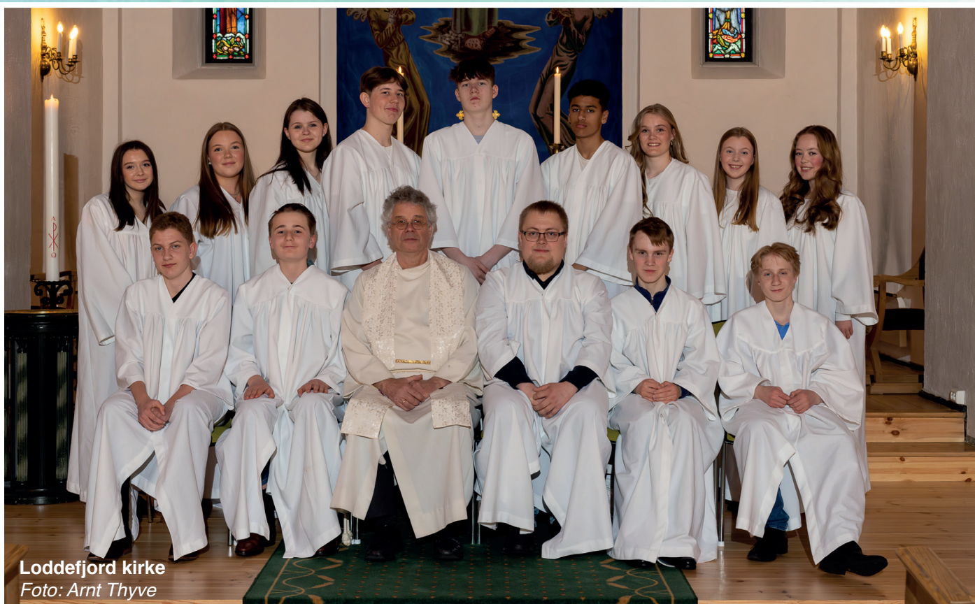
Loddefjord kirke