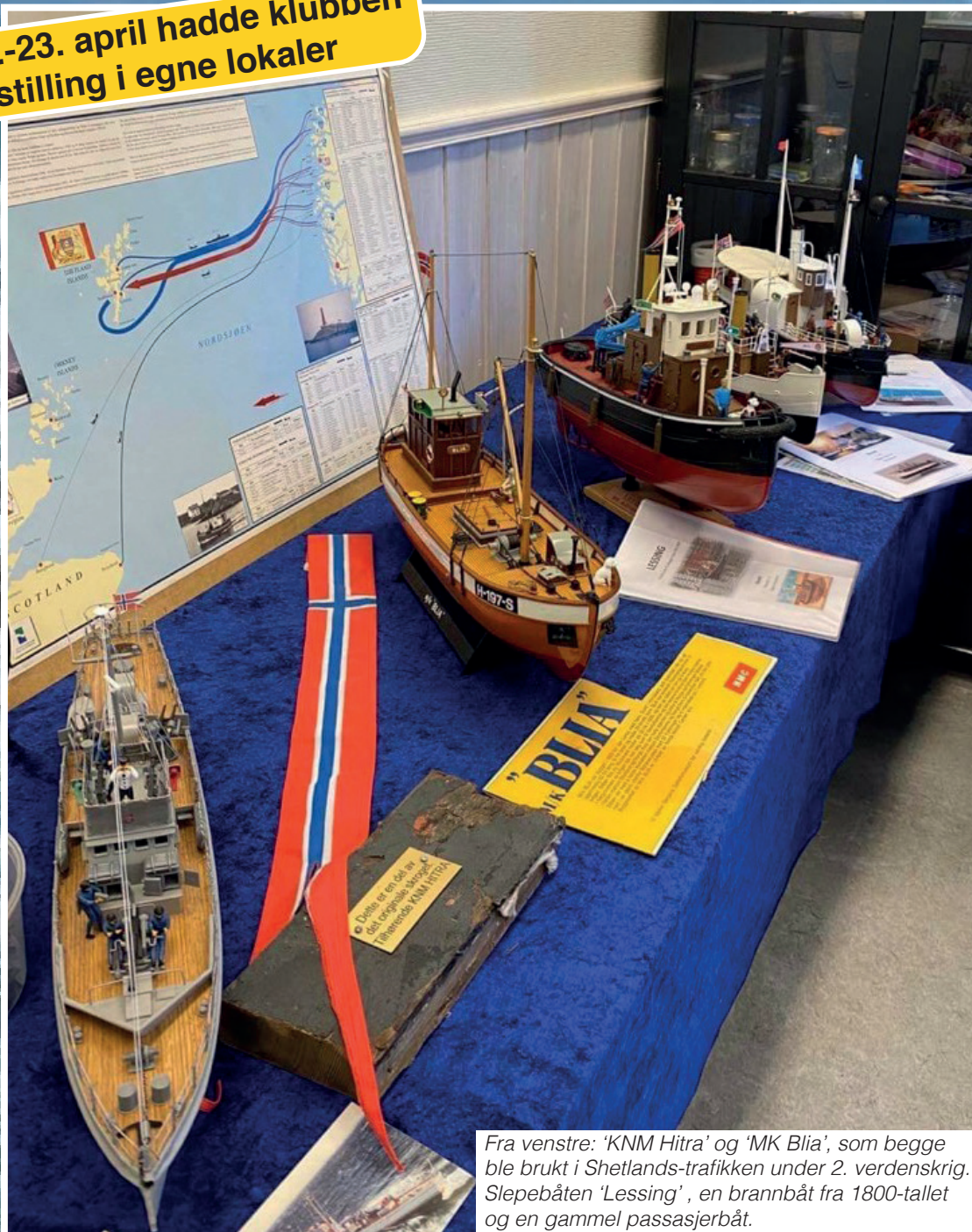
Fra venstre: 'KNM Hitra' og 'MK Blia', som begge ble brukt i Shetlands-trafikken under 2. verdenskrig. Slepebåten 'Lessing', en brannbåt fra 1800-tallet og en gammel passasjerbåt.

22.-23. april hadde klubben utstilling i egne lokaler