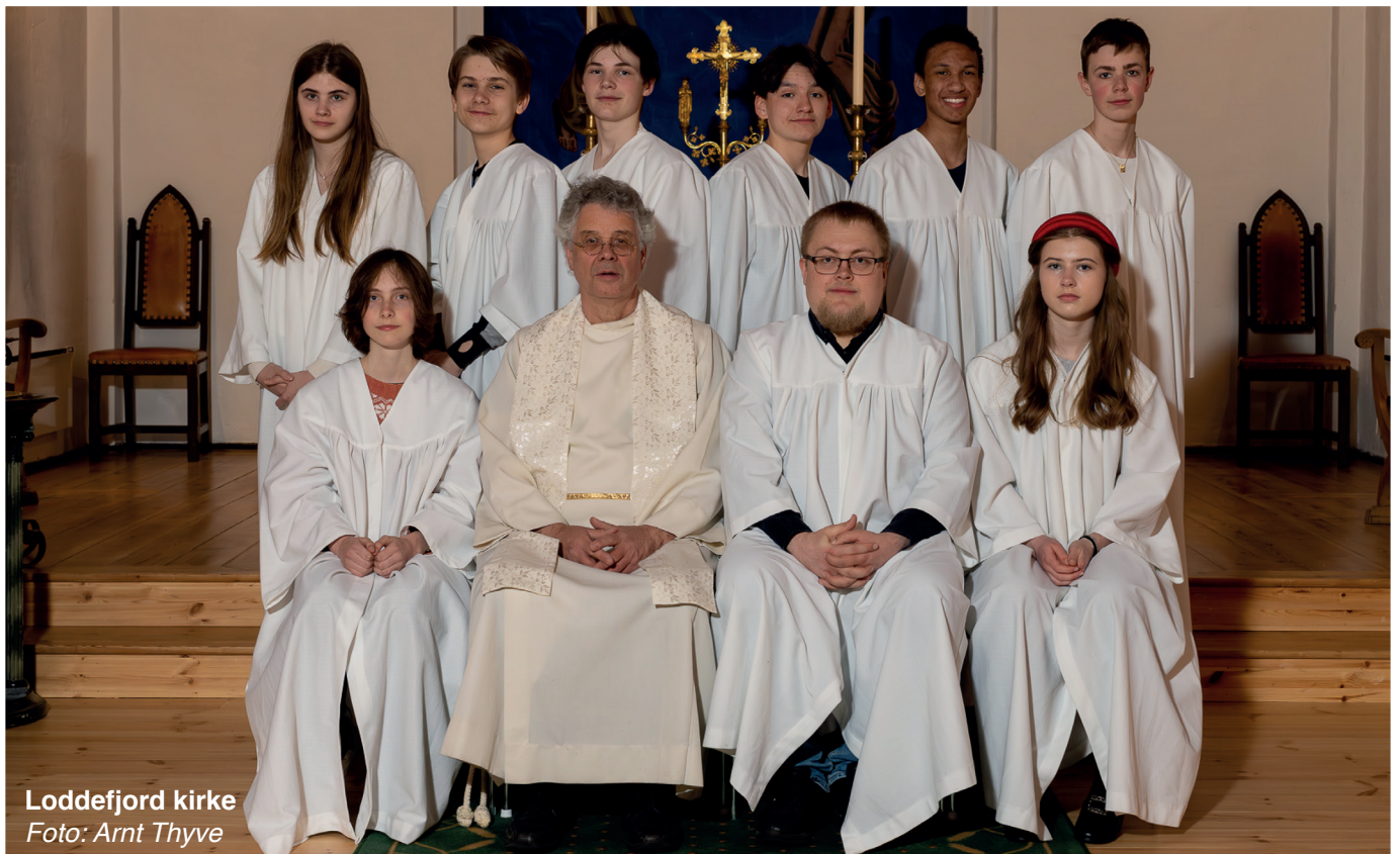
Loddefjord kirke