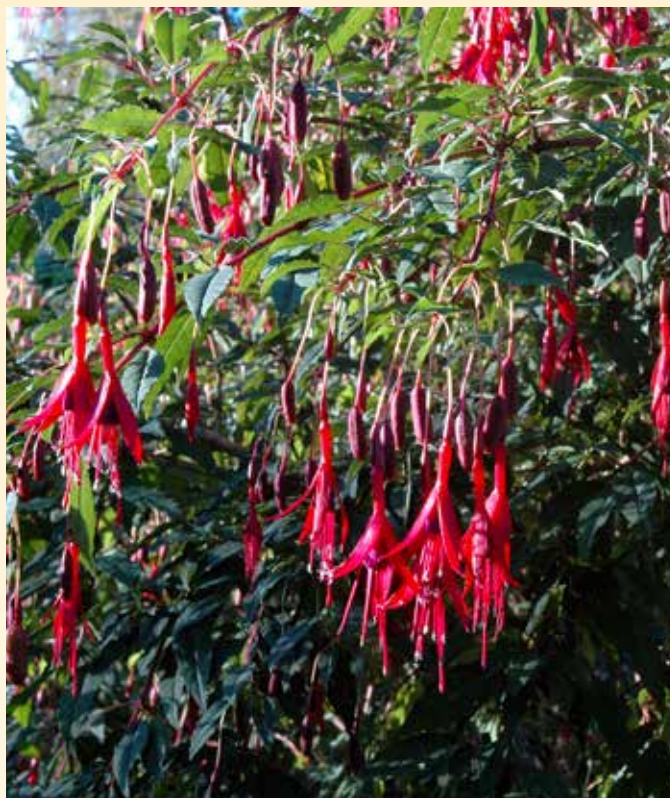
RØDE BLODSTÅRER: Fuksia eller Kristi blodsdråpe finnes i mange farger og varianter. Magellan-tåre ( Fuchsia magellanica ) er en av dem som overvintrer ute her hos oss. Den fryser ofte ned, men kommer igjen når varmen kommer.

En serie om blomster som gir assosiasjoner til troen og bibelens høytider.