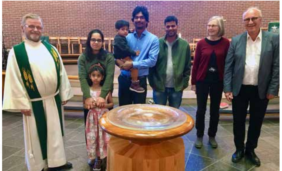
DROP-IN-DÅP I ÅSANE: En av familiene hadde med seg en jente på fem år og en gutt på to år, som begge ble døpt. Frivillige medarbeidere fra menigheten stilte som dåpsvitner.

På selve drop-in-dagen var dåpssakristiet gjort om til dåpsregistrerings-rom. Her ble man registrert, og det eneste man trengte til dette var legitimasjon. Når dette var unnagjort, ble dåpssamtale gjennomført med en av prestene som var til stede. Selve dåpshandlingen var en enkel seremoni, men like høytidelig som