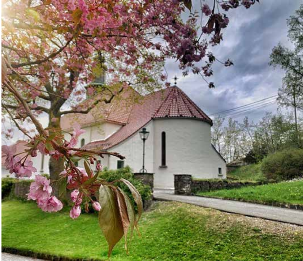
NÆRMER SEG JUBILEUM: NRK-gudstjenestene og Salhus kirke deler alder – om to år runder de begge 100 år!

Opptakene blir gjort 4., 5. og 6. april og