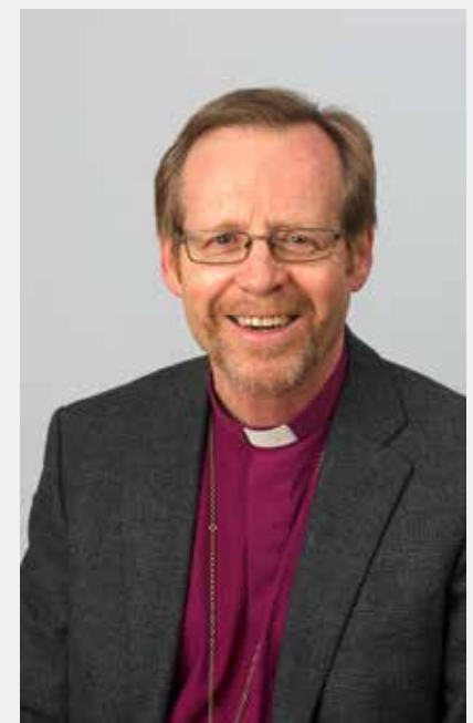
Halvor Nordhaug

Foredragsholder denne gangen er biskop Halvor Nordhaug, med overskrift «Hvorfor døde Jesus på korset?». Etter foredraget blir det enkel servering og mulighet for samtale om kveldens tema. Velkommen!