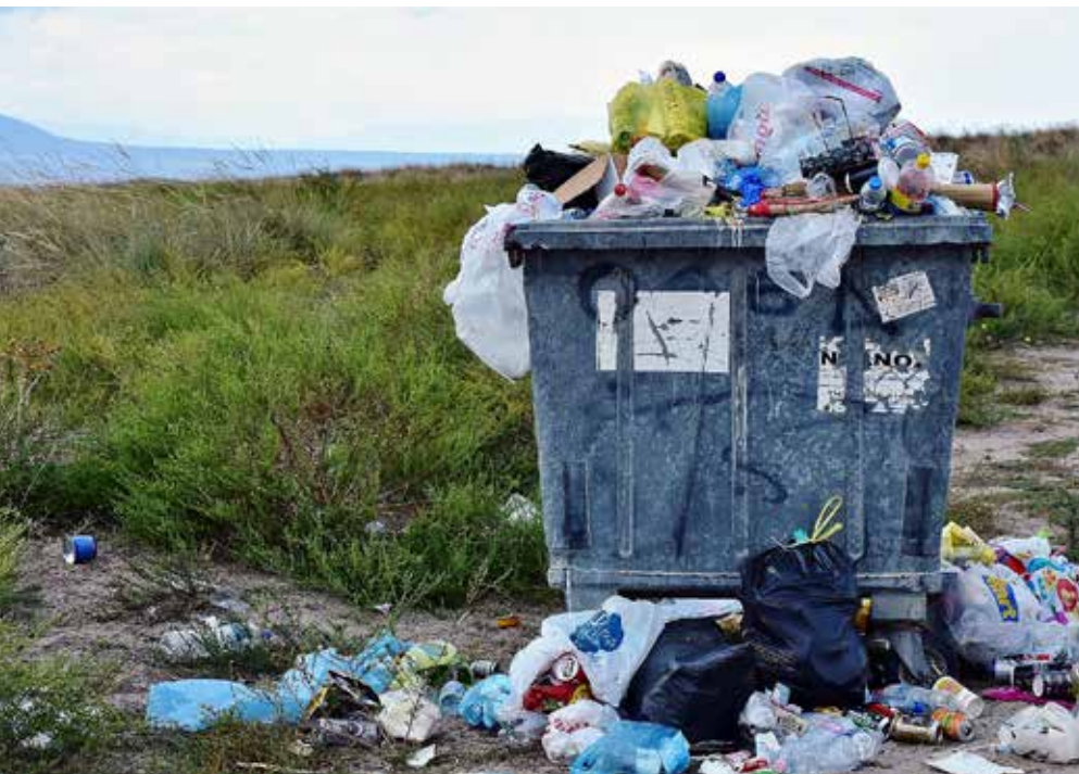
MOR HADDE RETT: Boss høyrer ikkje heime i naturen. Overforbruk og forureining er galt. Mor tok ansvaret sitt alvorleg.

Skulle du kjenne på at dette ansvaret er tungt å bære, så ta deg tid til å kvile i at Gud har allereie gjort sin del av ansvaret. Han har gjort opp for alt vi har rota til, ein gong for alle. Han har ikkje feia det under teppet, men betalt for skaden. Denne sanninga kan gje oss styrke til å ikkje feie vårt ansvar under teppet, men velge å bry oss. God påske!