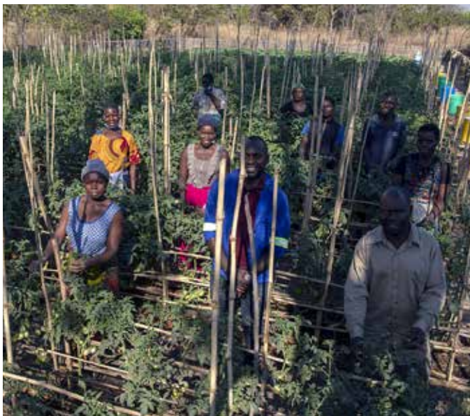
NYE METODER: De lokale bønderne får opplæring i moderne jordbruksteknologi, slik at de får mest mulig ut av grønnsaksåkrene.

små hull, slik at vannet pipler ut og gir en jevn vanning av grønnsakene.