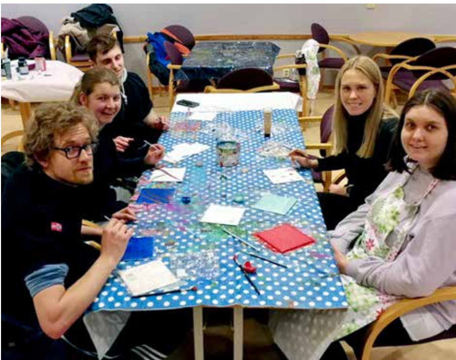
Kunstverksted på Klubb Xtra