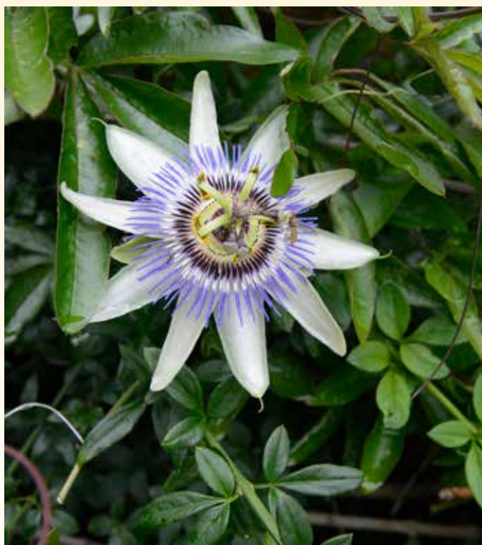
JESU LIDELSESHISTORIE GJEMT I EN BLOMST: Elementer i den vakre pasjonsblomsten ble tidligere brukt for å illustrere det som skjedde i påsken.

I senere tid er den blitt mye brukt på altan eller uteplass, og den liker seg godt om den får stå i solen. Den tåler også å tørke ut, så om du drar på hytta ei uke, pleier det å gå veldig fint.