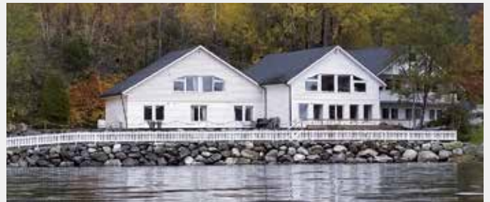
STILLA I NATUREN: Holmely ligg i sjøkanten, like ved riksveg 15 på Bryggja i Nordfjord, med flott utsyn mot fjell og fjord.

Store delar av laurdagen er sett av til pilegrimstur til øya Selja. Brosjyre er lagt ut på internettssidene til Bjørgvin bispedøme og Holmely ( www.holmely.no og www.retreater.no/retreatsted/holmely ). Pris per person: Dobbelrom kr. 2700,- / enkelrom kr. 2900,-.