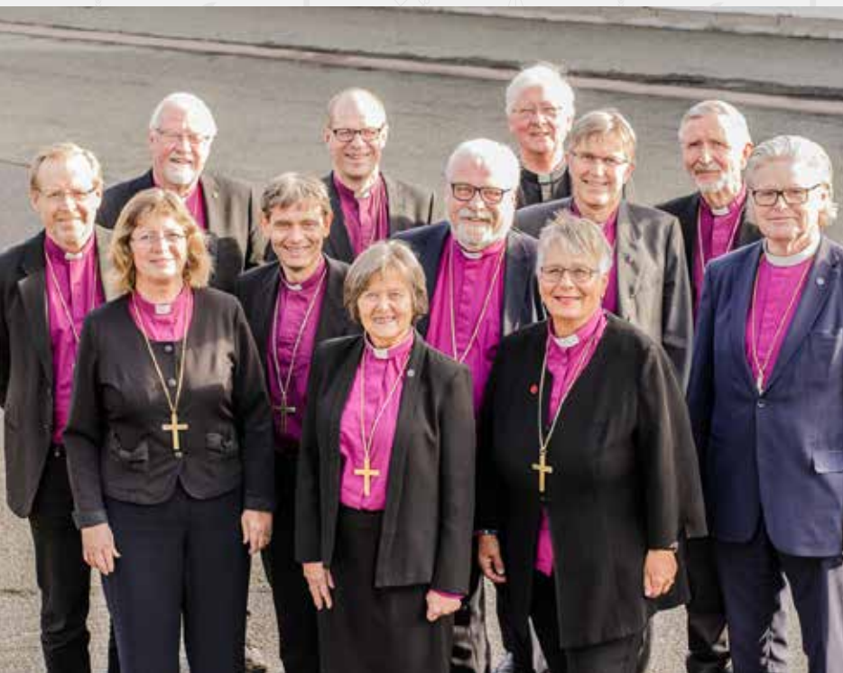
ØNSKER LITURGI FOR LIKEKJØNNET EKTESKAP: Biskopene ser ulikt på spørsmålet om likekjønnet vigsel, men har likevel arbeidet seg frem til en enighet om hvordan kirken bør gå videre i denne saken.

Kirkerådet har nå gitt sin tilslutning til Bispemøtets forslag om at Kirkemøtet skal vedta liturgier for ekteskapsinngåelse mellom likekjønnede.