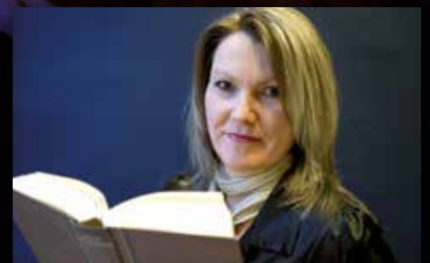
Inviterer til Bibelfestival Side 7