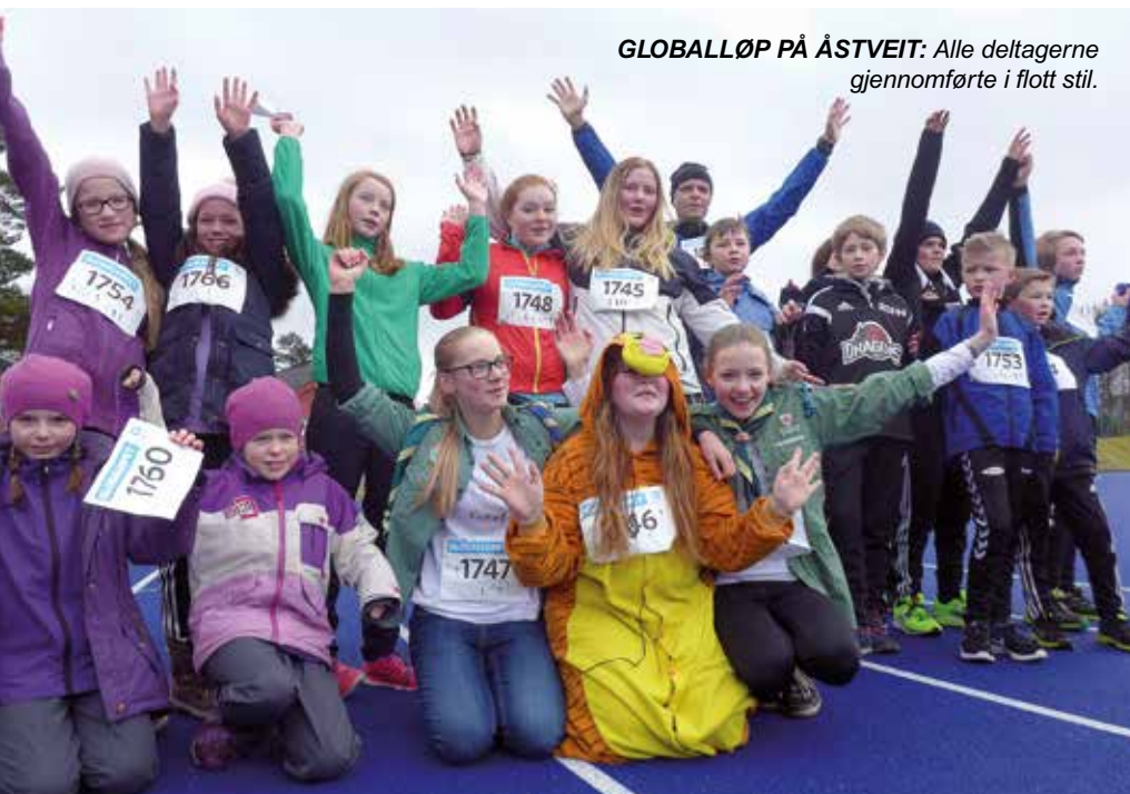
GLOBALLØP PÅ ÅSTVEIT: Alle deltagerne gjennomførte i flott stil.

Lørdag 20. februar arrangerte Rolland og Flaktveit KFUK-KFUM-speider globallop på Åstveitbanen.