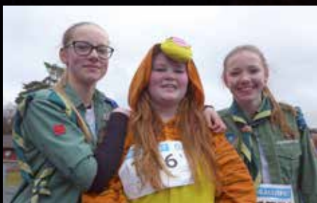
Speideraksjon for foreldreløse barn Side 4

(Illustrasjon: «Oppstandelsen», utsnitt fra en større altertavle med scener fra Jesu liv, laget av Matthias Grünewald på begynnelsen av 1500-tallet).