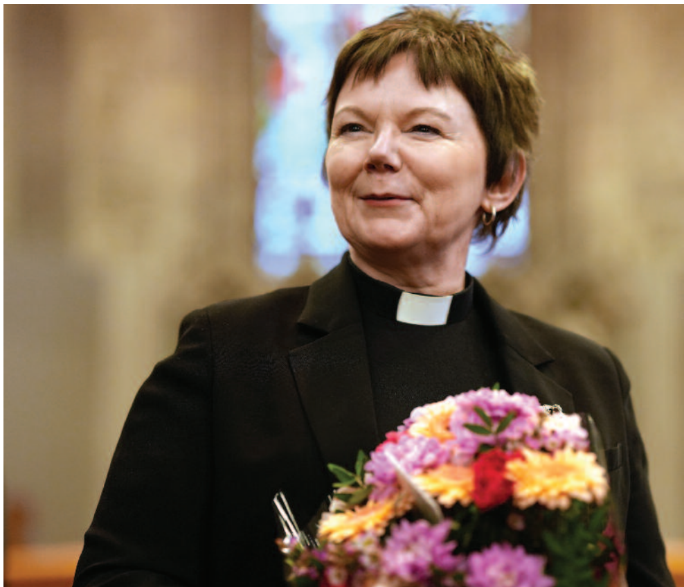
NY BISKOP: Ragnhild Jepsen gler seg til å bli vigsla som biskop i Bergen domkirke 16. april.

– Eg gler meg til å flytte til Bjørgvin og ser fram til å bli kjent i byen og fylket. Det blir mykje nytt, ikkje minst det å etablera seg med eit nettverk, også på fritida, det er eit arbeid i seg