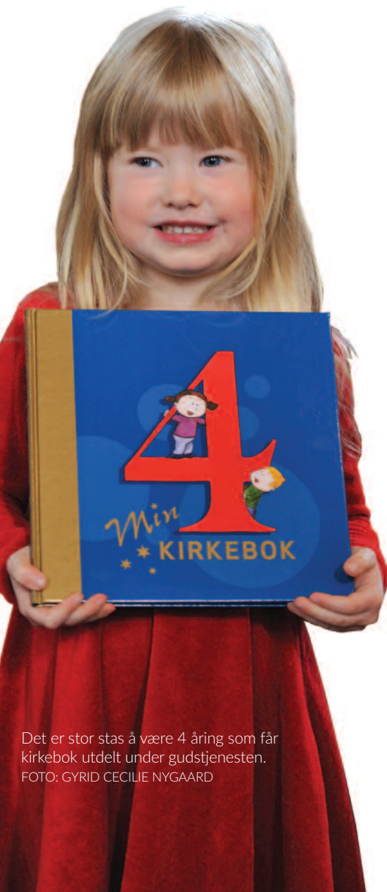
Det er stor stas å være 4 åring som får kirkebok utdelt under gudstjenesten.

Merk: Høstens treårsarrangement (egen fredagstaco) og seksårsarrangement (skolestartmarkering) ble gjennomført før dette bladet ble trykket.