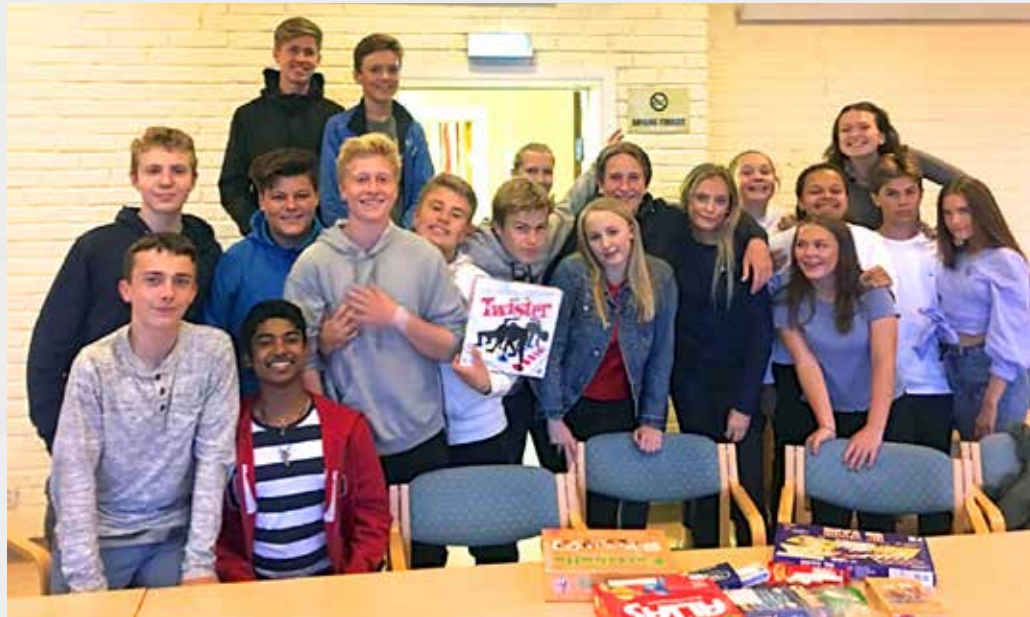
IDÉDUGNAD I KIRKEN: Ungdom i nærområdet ble invitert til idédugnad. Rundt 20 stilte, og alle var enig om å starte en ungdomsklubb drevet av ungdommene selv, med støtte fra foreldre og stab. (Foto: Nadine Larsen).

14. september, 19. oktober, 16. november og 7. desember.