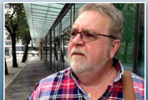
– Ein må slutta å vera Gud i eige liv. Side 12-13