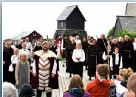
Historiespel i havgapet