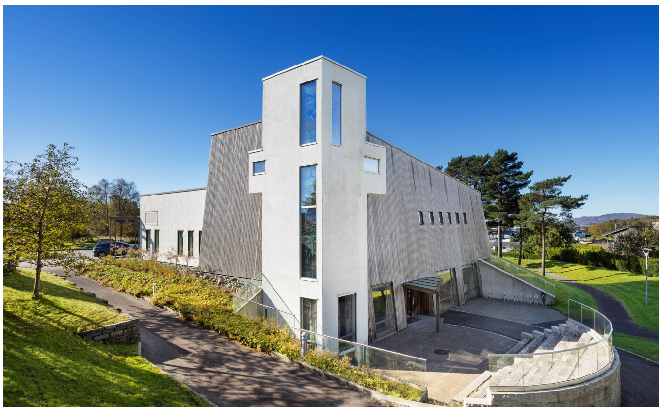
Ytrebygda kirke.