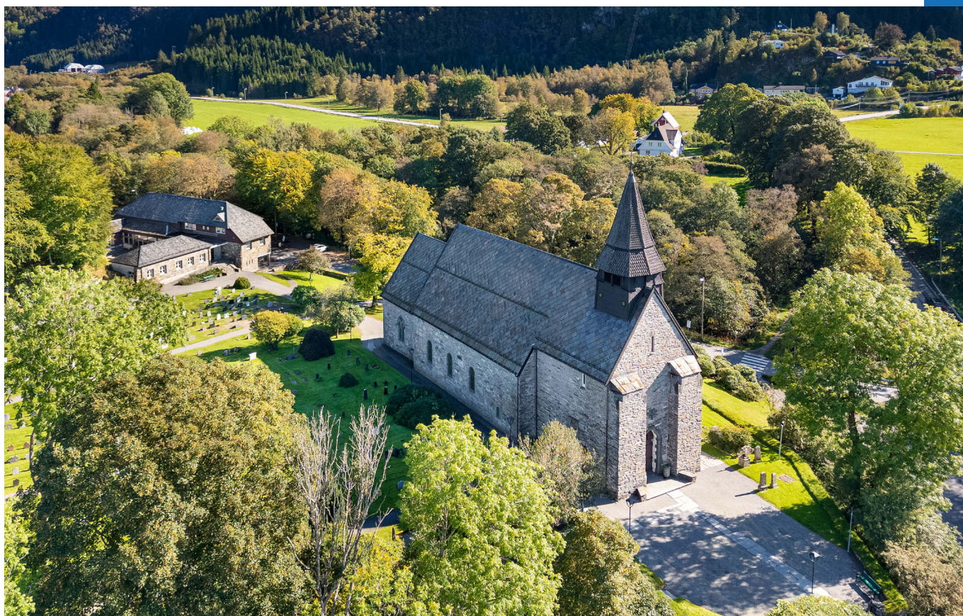
Fana kirke.