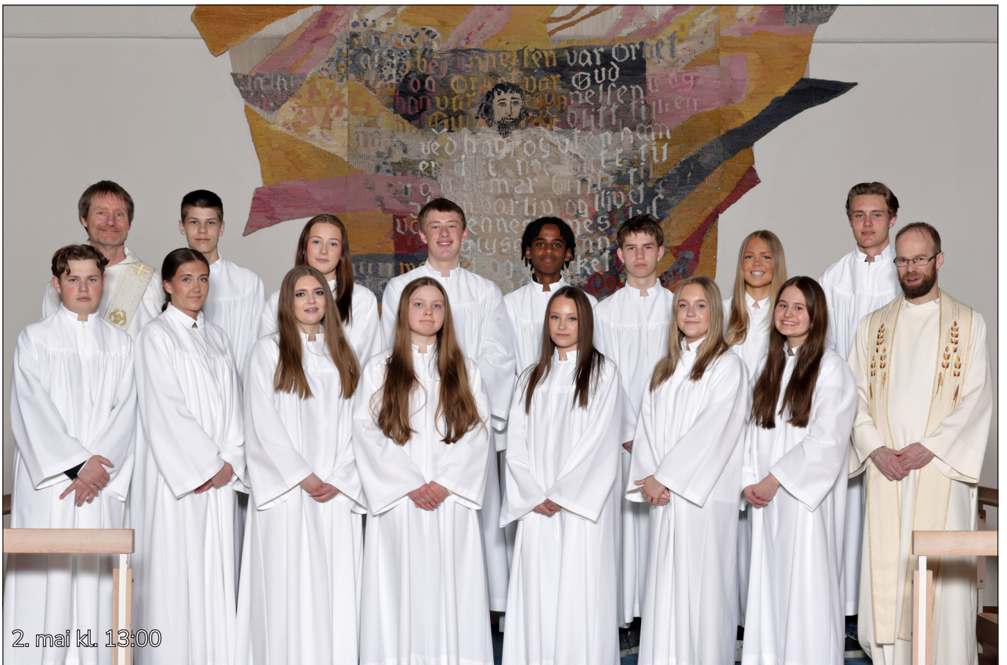
2. mai kl. 13:00