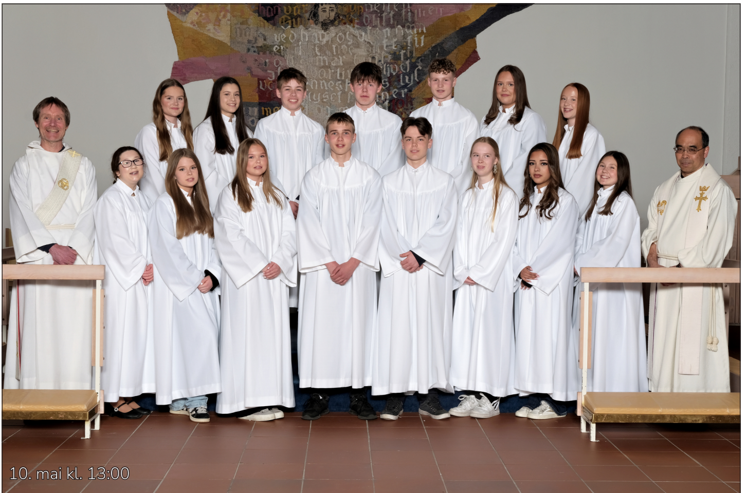
10. mai kl. 13:00