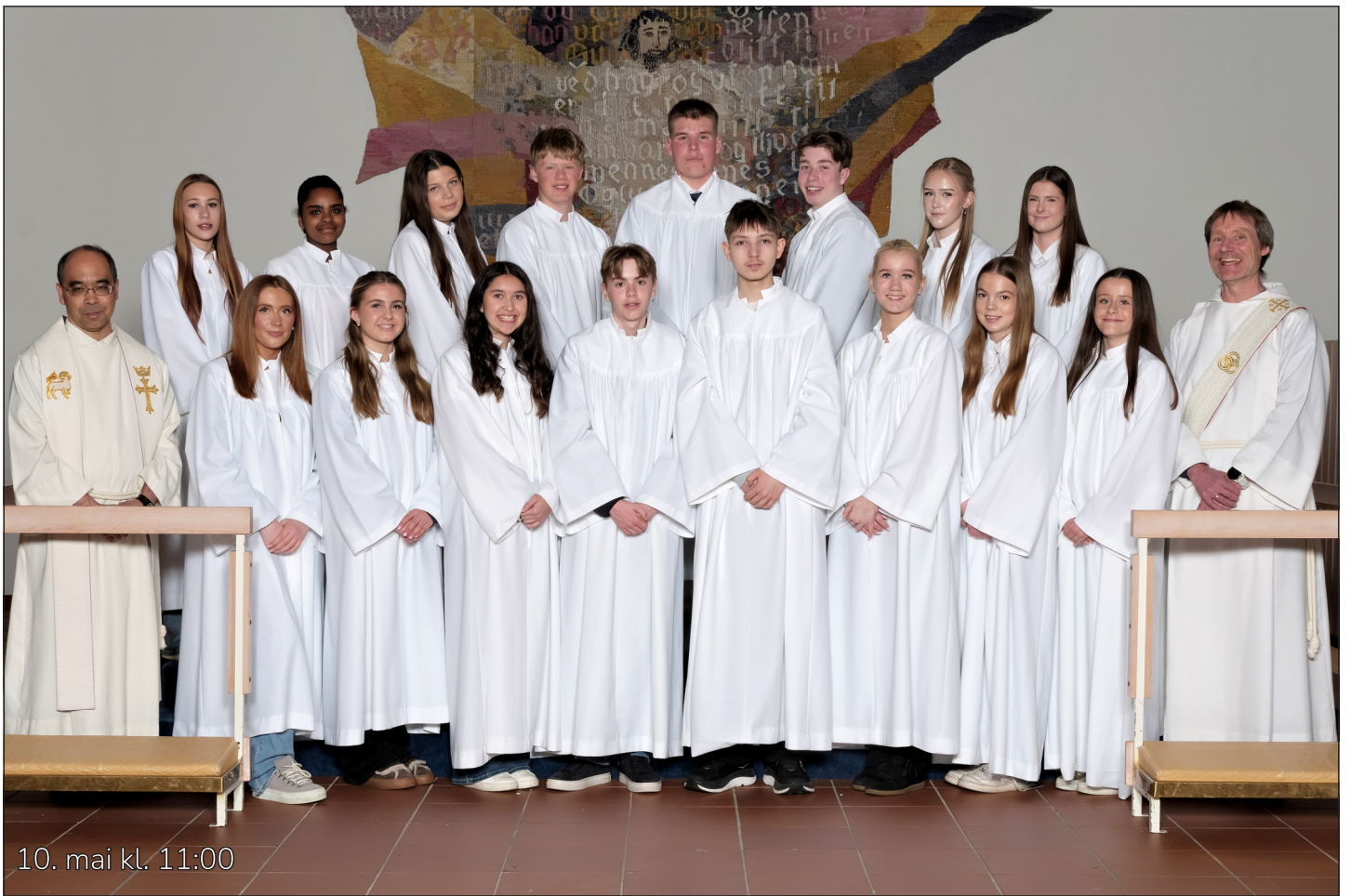
10. mai kl. 11:00