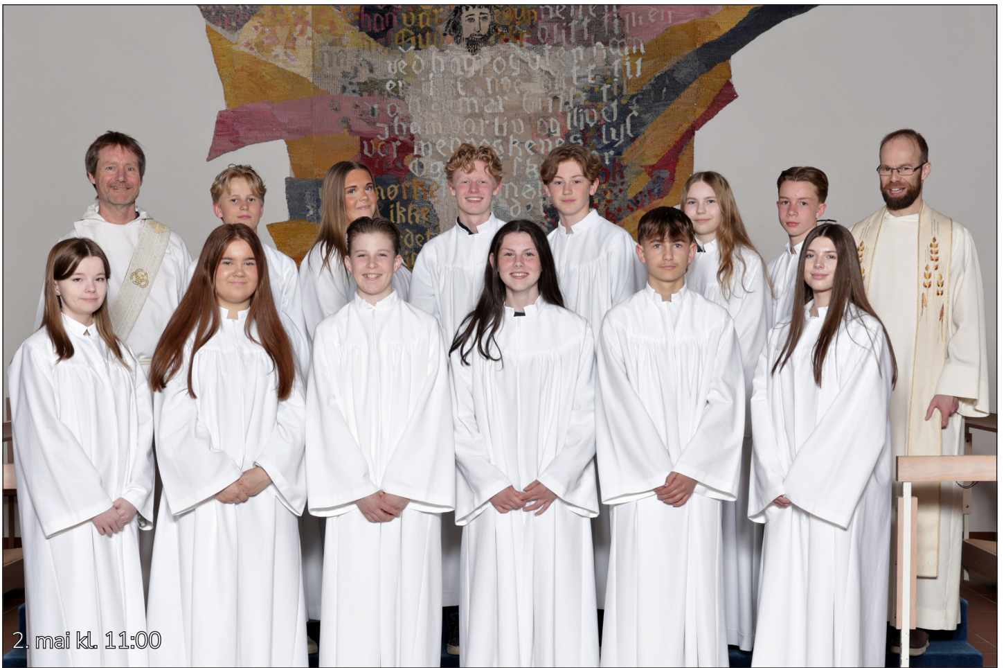
2. mai kl. 11:00