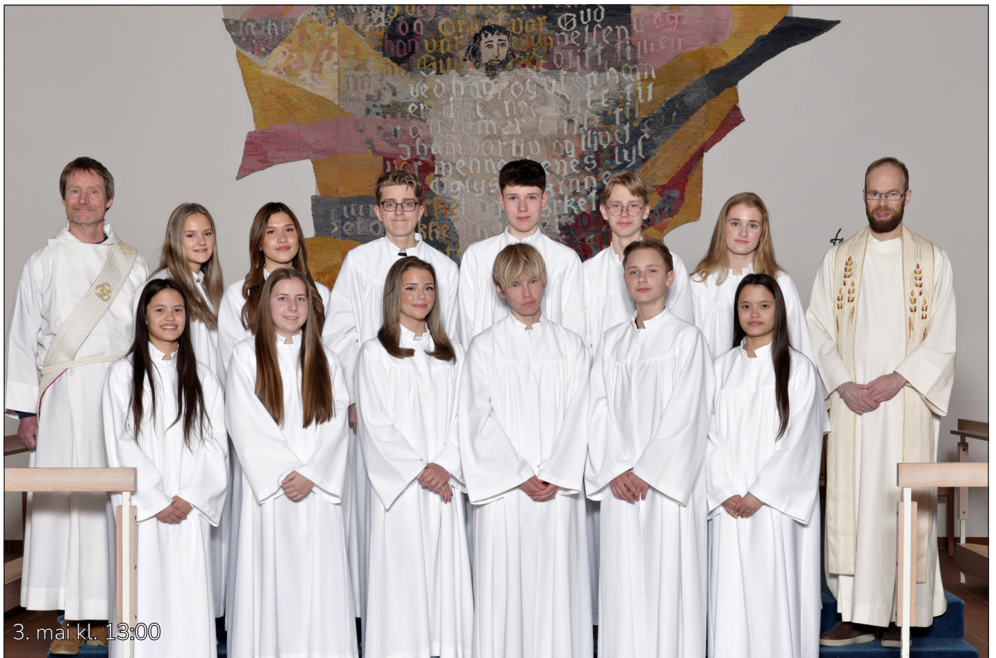
3. mai kl. 13:00