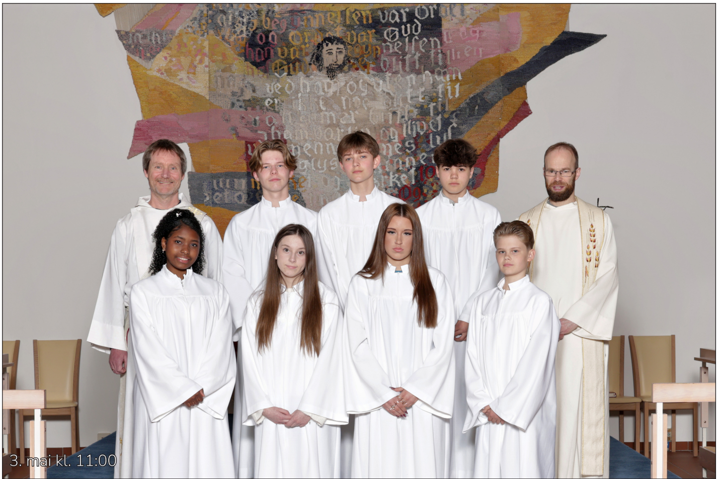
3. mai kl. 11:00