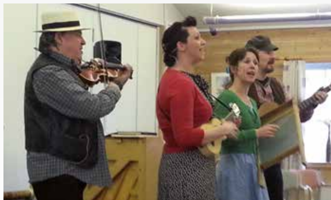
IMPONERTE MED PRØYSEN-KABARET: Teatergruppen Krabatene framførte en forrykende Prøysen-kabaret på Klubbens kulturkafe i april.