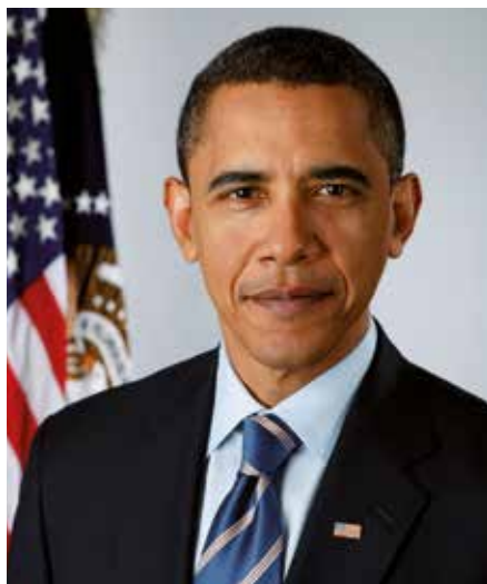
TALTE TIL USAs NYE BORGERE: «USA er født av immigranter» sa Barack Obama i en tale han holdt under en borgerskaps-seremoni i midten av desember.

Det har vært gjort flere forsøk på å beregne hvor mange innfødte det bodde på det nordamerikanske kontinentet da Christopher Columbus ankre opp utenfor Bahamas 12. oktober 1492; sannsynligvis er det snakk om et sted mellom to og 18 millioner. Antallet minket imidler-