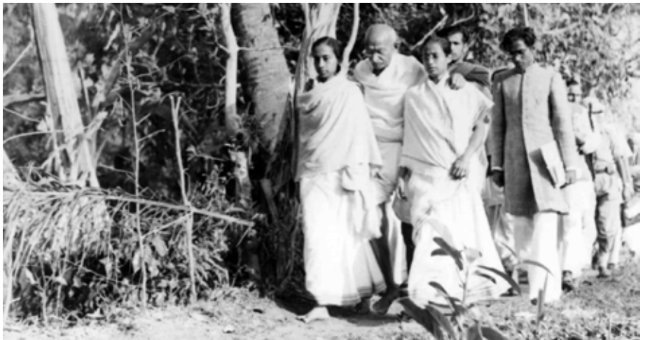
BARFØTT OPPRØRSLEDER: Mahatma Gandhi på vandring for å besøke de overlevende etter muslimenes massakre av hinduer i Noakhali (Bangladesh). Den barføtte 78-åringen startet vandringen 6. november 1946, besøkte 47 landsbyer og tilbakela til sammen 186 kilometer i løpet av syv uker.

Mahatma Gandhi gikk stort sett barføtt rundt på jorden, noe som har fått vittige tunger til å hevde at det er ham Julie Andrews synger om i Mary Poppins: «A super calloused fragile mystic hexed by halitosis». Den dårlige ånden (halitosis) skulle da skyldes hans vegetariske livsstil. Dem om det, men