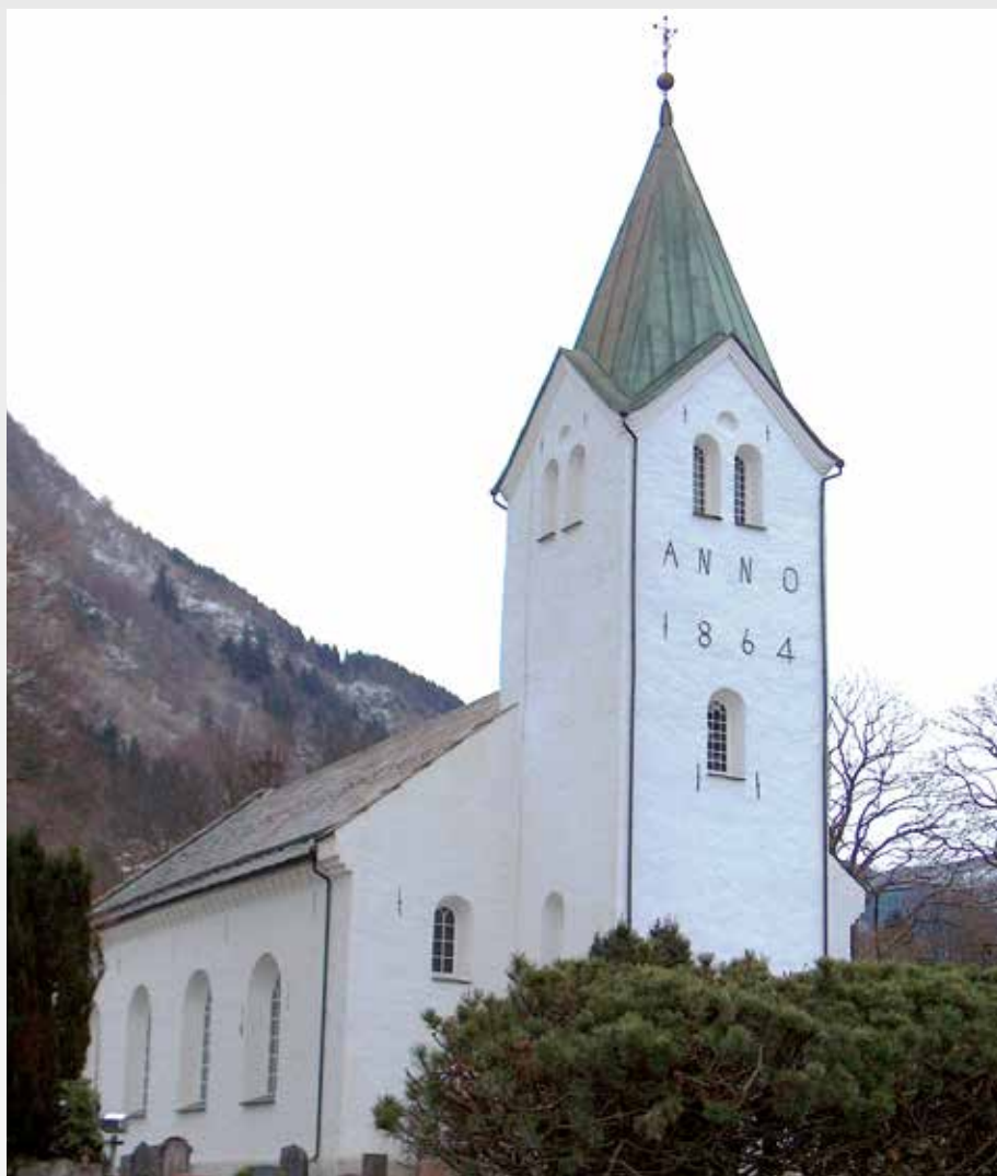
Arna kirke (foto: Svein Harkestad).

Kirkejubileet i Arna ble delt opp i en lang rekke arrangementer fordelt mellom kulturdagene i april og en avsluttende jubileumsgudstjeneste 6. desember, samme dato som kirken ble vigslet for 150 år siden.