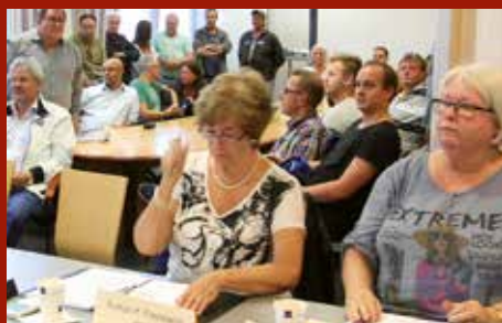
Akasia er blitt aksjeselskap

Kirkejubileet i Arna ble delt opp i en lang rekke arrangementer fordelt mellom kulturdagene i april og en avsluttende jubileumsgudstjeneste 6. desember, samme dato som kirken ble vigslet for 150 år siden. Side 14-15