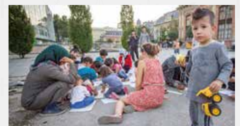
PÅ FLUKT: En tilværelse på gata i et fremmed land - en situasjon som ikke kan vare.

Mer informasjon: www.kirkeaktuelt.no/alt-om-flyktnings-situasjonen