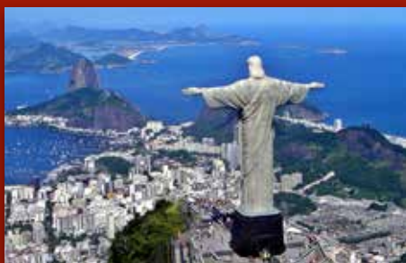
Ja til «godhetstyranniet»