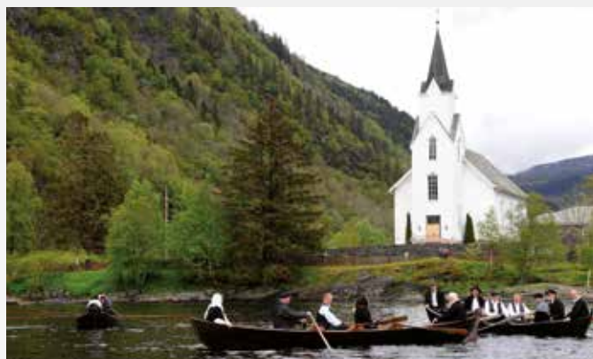
FREMME VED HAUS KYRKJE: Tre gamle kirkebåter i kirkeskysv fra Tunes til Haus..