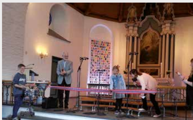
SNOREN KLIPPES: Barnevennlig jubileumsåpning med snorklipping. Legg merke til Ådnamarka-elevenes banner av Frans av Assisis bønn på veggen bak.