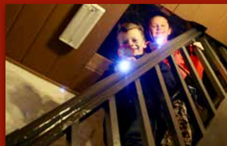
På hemmelig oppdrag