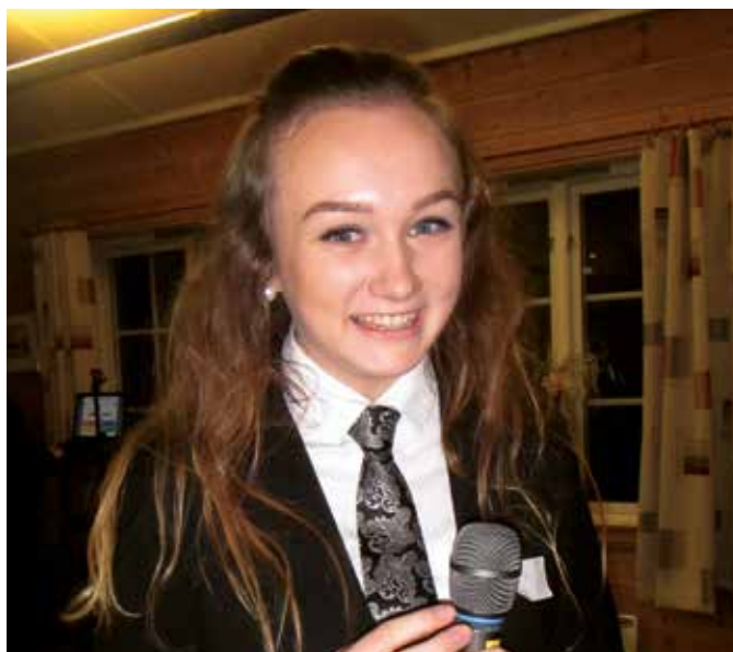
Kija er konferansier og agent.