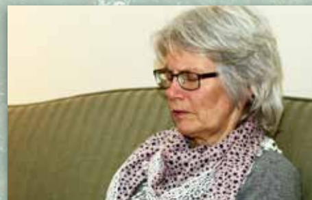
Bønn og fellesskap