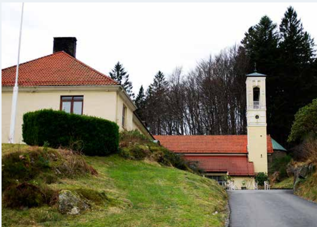
MARIAS MINDE: Traust og trygt ruver det gule huset på en liten ås over Helleveien, med Vår Fruens kirke (eller «søsterkapellet», som de sier selv) ved siden av.

kjøpe den der, enn å ha egen kokk på Marias Minde.