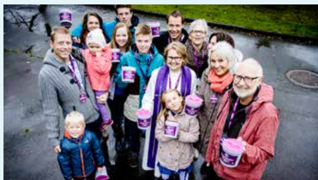
BLI BØSSEBÆRER: Ta godt imot bøssebærerne, eller meld deg til tjeneste selv!