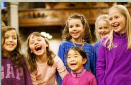
Påskefest for alle