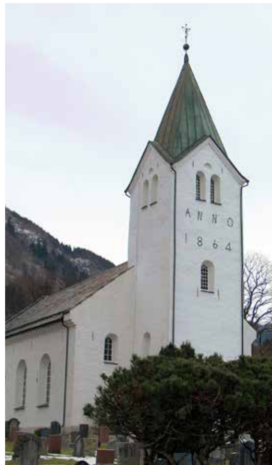
Arna kyrkje.