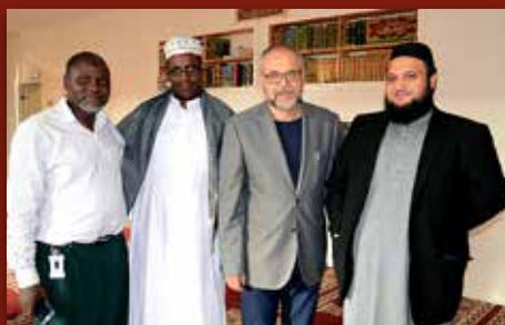
Dialog mellom åndsbrødre

«Ære vere Gud i det høgste, og fred på jorda blant menneske Gud har glede i!»