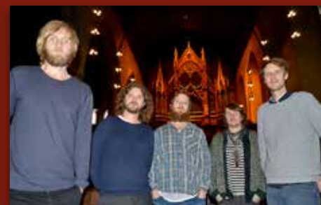
Juleplate fra Real Ones