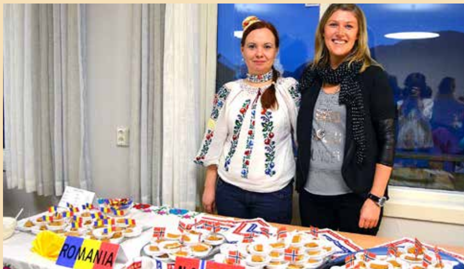
Det blei servert rumensk og norsk mat.

Den 30. oktober arrangerte Noa open barnehage kulturkafé for innbyggerane i Ytre Arna. Dette var tein stor suksess. Meir enn 100 persona.