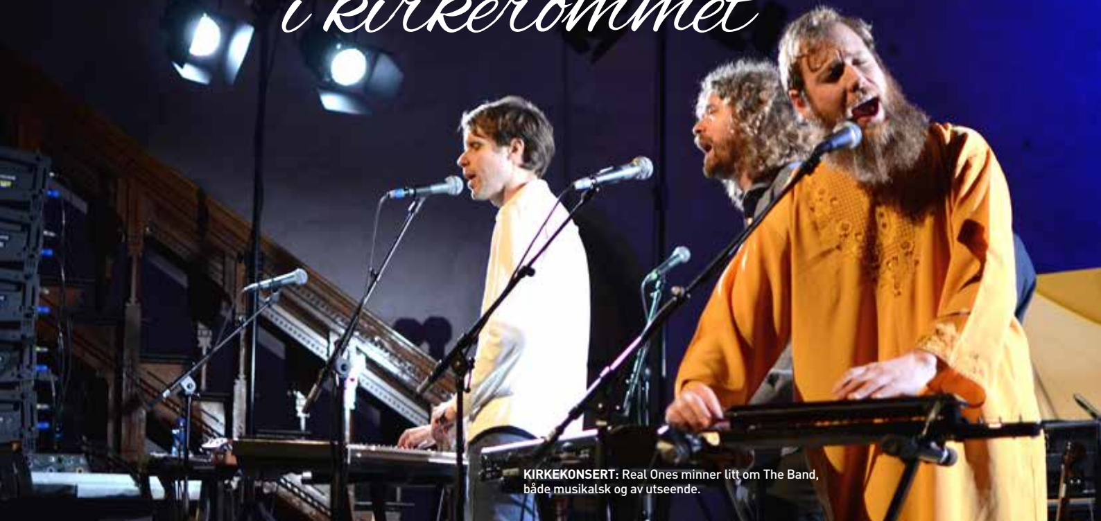
KIRKEKONSERT: Real Ones minner litt om The Band, både musikalsk og av utseende.