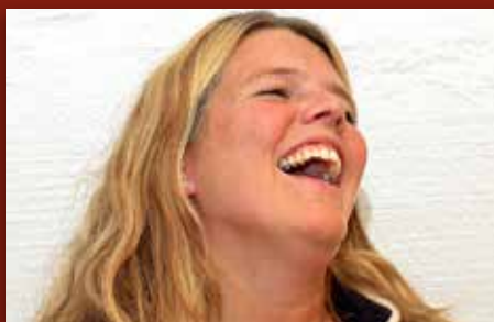
Gro holder koken