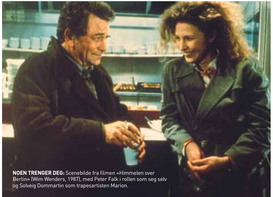
NOEN TRENGER DEG: Scenebilde fra filmen «Himmelen over Berlin» (Wim Wenders, 1987), med Peter Falk i rollen som seg selv og Solveig Dommartin som trapesartisten Marion.