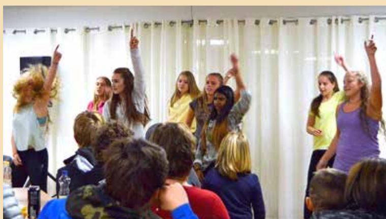
Danseoppvising fra Indre Arna-konfirmanter.