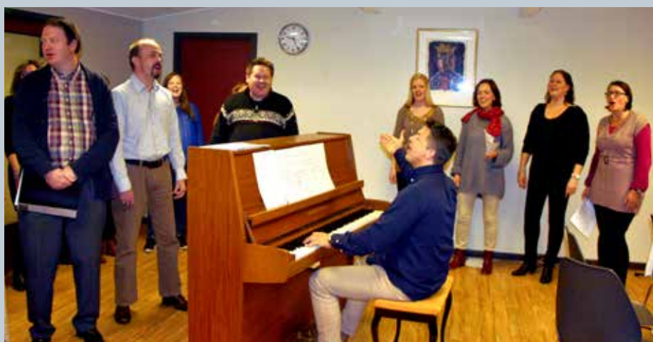
Opptreden på medarbeiderfest 7. november, korets fyrste opptreden