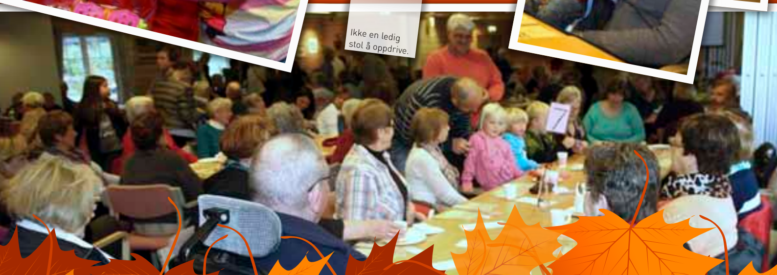
Ikke en ledig stol å oppdrive.