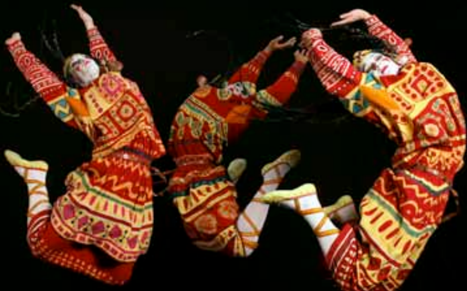
JULEGAVETIPS: Både Joffrey-balletten fra Chicago (bildet) og den russiske Mravinskij-balletten har gjenskapt Nijinskis fargerike ballettforestilling. Sistnevnte er utgitt på en praktfull bluray sammen med deres versjon av Stravinskis andre store ballettmesterverk; Ildfuglen.

– Ja, og du har det samme både i den gamle sanskrit-stavelsen «om», som henger sammen med skapelsen av verden, og i Bibelen, sier han, og viser til de kjente åpningsordene i Johannesevangeliet: «I begynnelsen var Ordet. Ordet var hos Gud, og Ordet var Gud».