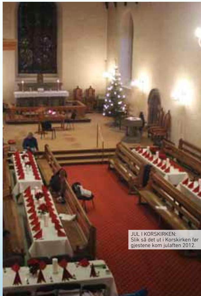
JUL I KORSKIRKEN: Slik så det ut i Korskirken før gjestene kom julaften 2012.