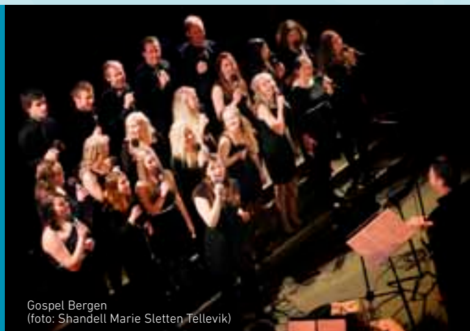
Gospel Bergen

• Mer informasjon: www.gospelbergen.no og på egen Facebook-side.