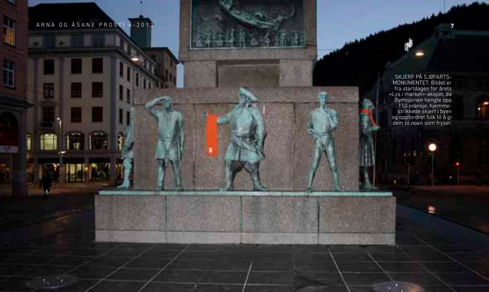
SKJERF PÅ SJØFARTS-MONUMENTET: Bildet er fra startdagen for årets «Lys i mørket»-aksjon, da Bymisjonen hengte opp 150 oransje, hjemmestrikkede skjjerf i byen og oppfordret folk til å gi dem til noen som fryser.

fald. HSF er eit verdensspennande familiestøtteprogram, der frivillige medarbeidarar kjem heim til småbarnsfamiliar som treng støtte i ein periode. I Oppvekst og mangfald er det ei brei vifte av tilbod til familiar med barn og ungdom i huset. Det at fleire tiltak er retta mot barnefamiliar, gjer det mogleg for mange å finne noko som passar deira behov.