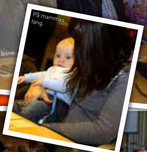
På mammas fang.