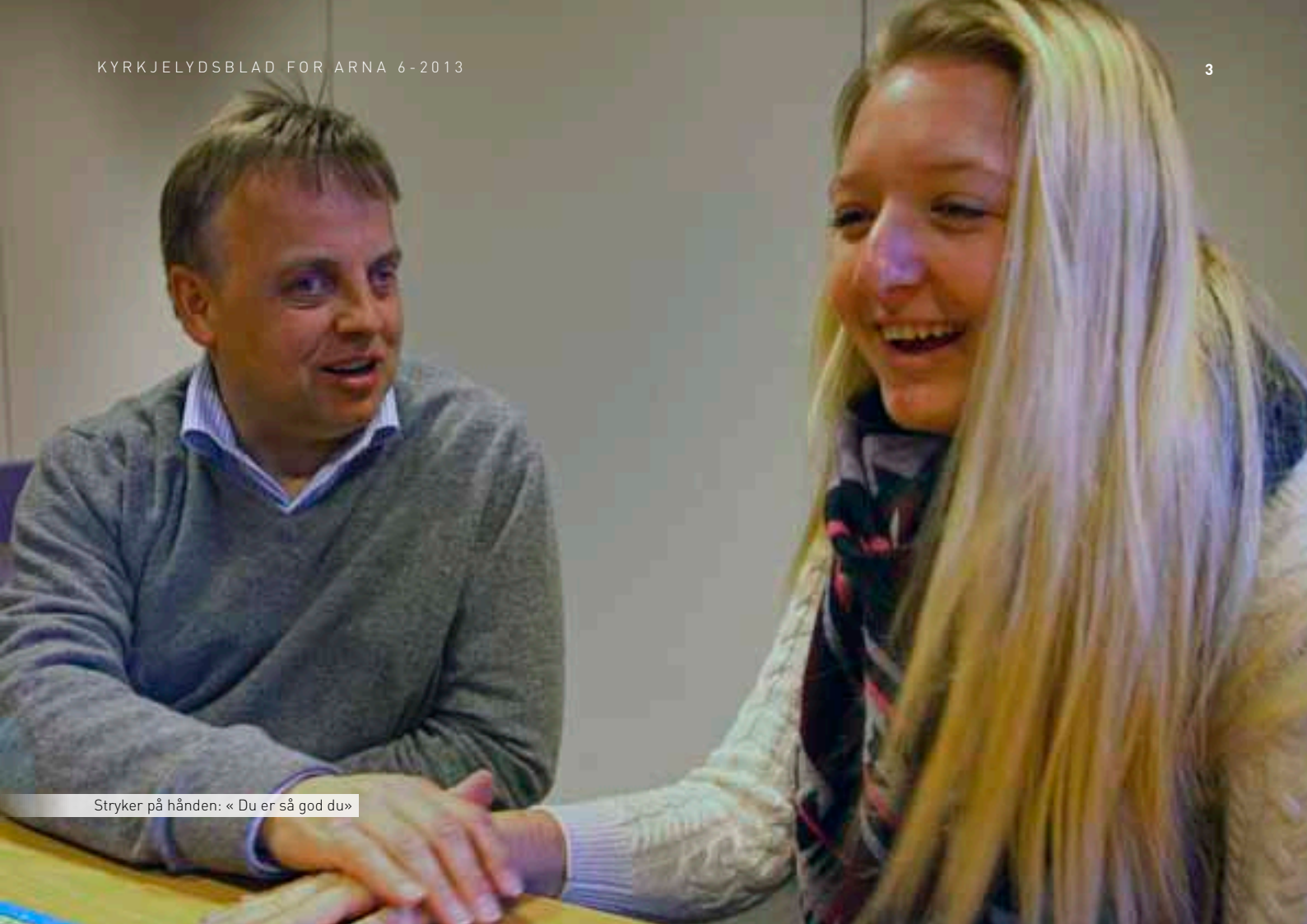
Stryker på hånden: « Du er så god du»