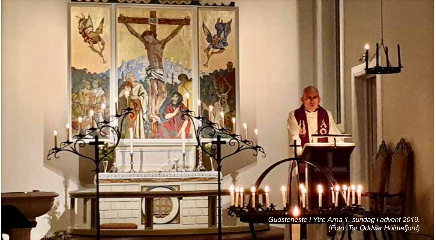
Gudsteneste i Ytre Arna 1. søndag i advent 2019.

I 2019 vedtok Kyrkjemøtet revidert ordning for hovudgudstenesta. Mange meinte ordninga frå 2012 sleppte alt for mykje fritt, ikkje minst på det musikalske området. Ein ting var at gudstenesta kunne verka framand om du vitja ei anna kyrkje enn den du var van med å gå i, ein annan at vikarprestar og -organistar ikkje alltid fekk det så lett.