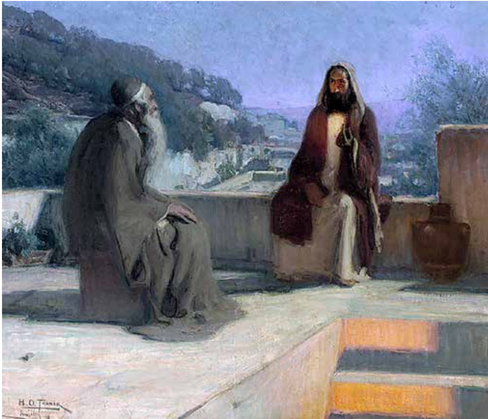
NICODEMUS OG JESUS: Kvifor Nikodemus kom til Jesus om natta står det ingenting om, men kanskje han var redd for kva dei andre sa. Illustrasjon: «Jesus og Nicodemus», oljemåleri av denm amerikanske biletkunstnaren Henry Ossawa Tanner (1859-1937).

Forteljinga begynner slik: «Det var ein mann som heitte Nikodemus. Han var farisear og sat i Rådet til jødane. Han kom til Jesus om natta». Samtalen mellom Nikodemus og Jesus seier meg mykje om kven Jesus er, og kva som var Guds plan med at Jesus vart sendt til vår jord.