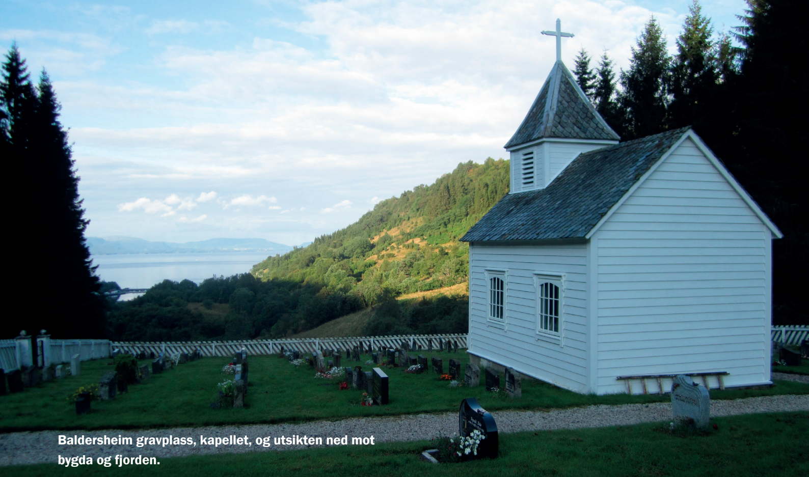
Baldersheim gravplass, kapellet, og utsikten ned mot bygda og fjorden.