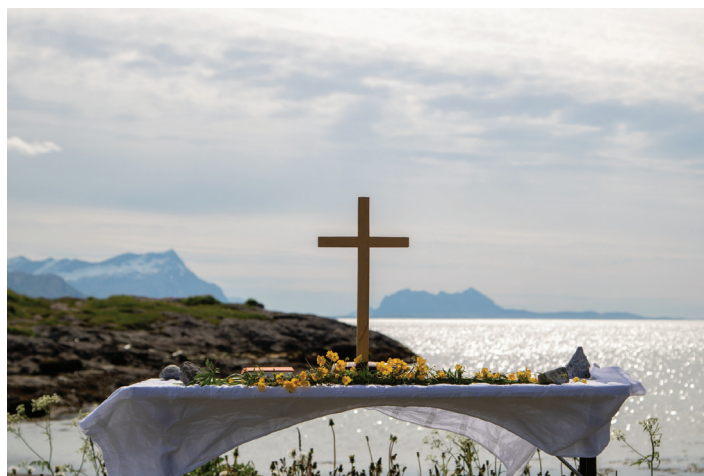
Se nærmere info på skjerikirken.no

Kjerringøy kirke torsdag 20. august: Kammerkonsert med Musikk i Nordland