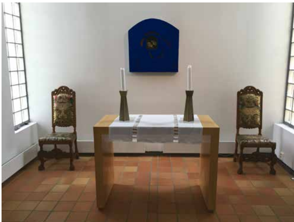
Brudestolene ved Maria-alteret.