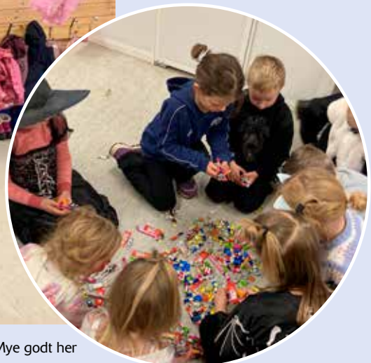
Mye godt her