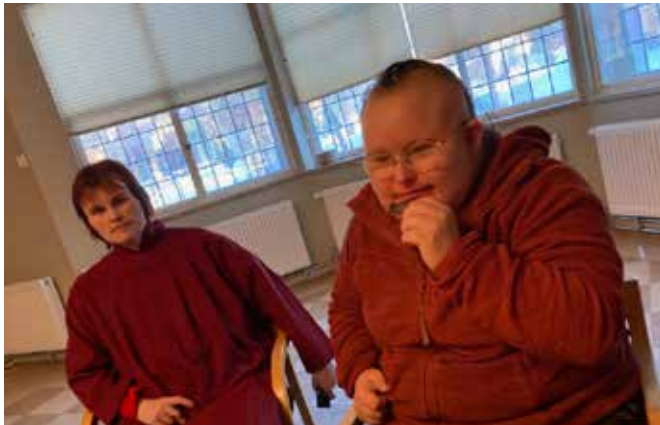
Hanne og Natalie

To ganger i året møtes «De utrolige» fra hele Bodø i et av byens kirkerom. Denne helgen i februar var det domkirka som var vårt vertskap. Fra vår menighet deltok to unge damer.