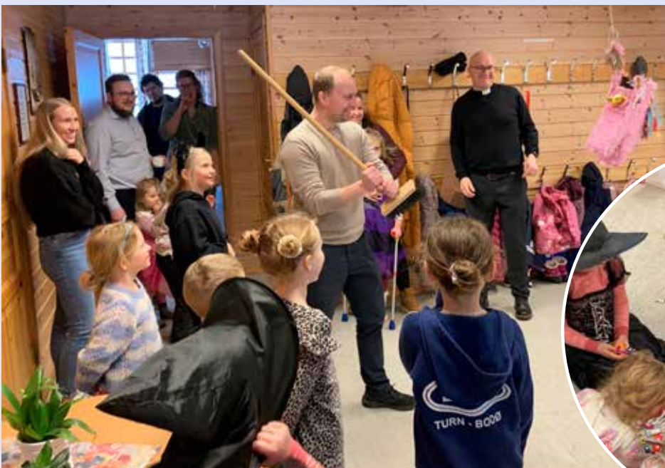
Gøy med pinjata