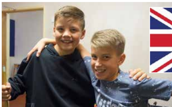
Unge i England

Det er en stor glede for Saltstraumen menighet å kunne bidra økonomisk for å støtte NMS sitt arbeid i England. Har du lyst til å bli ettåring? Da er du en voksen ungdom som hjelper til med arbeid for barn og unge et sted i ett år. For mange år siden var det en fra vår menighet som dro til England som ettåring. Kanskje du kjenner noen som har lyst til å dra? NMS har et program for dette: Ucrew.