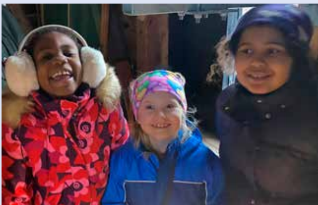
Oppe i tårnet