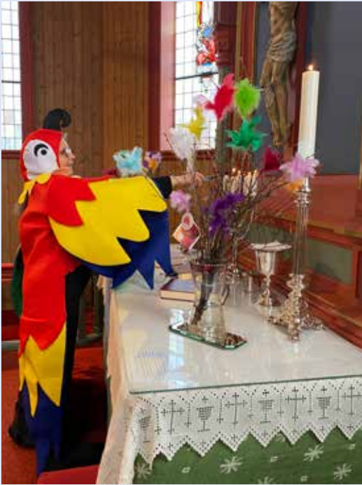
Kirketjener og papegøye i arbeid