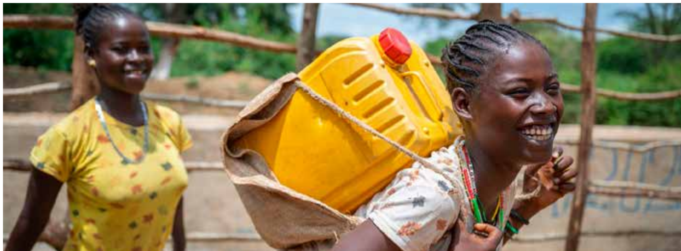
South Omo Etiopia sanddam

Tekst: Åsne Gullikstad