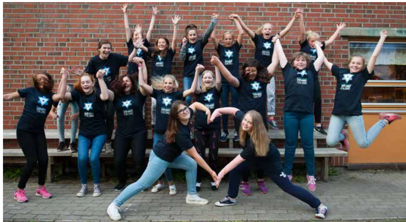
Ten Sing har vært gøy - helt fra start

Tekst: Linn-Marie Estensen