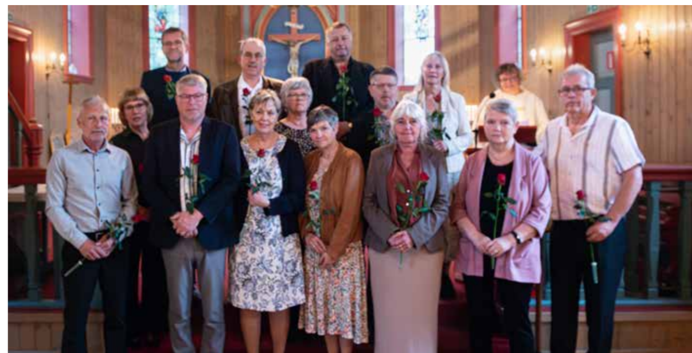
Årets 50-årskonfirmanter