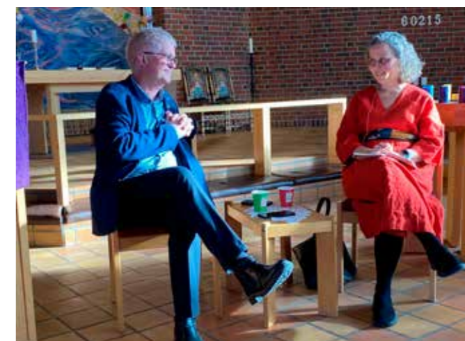
En fin samtale