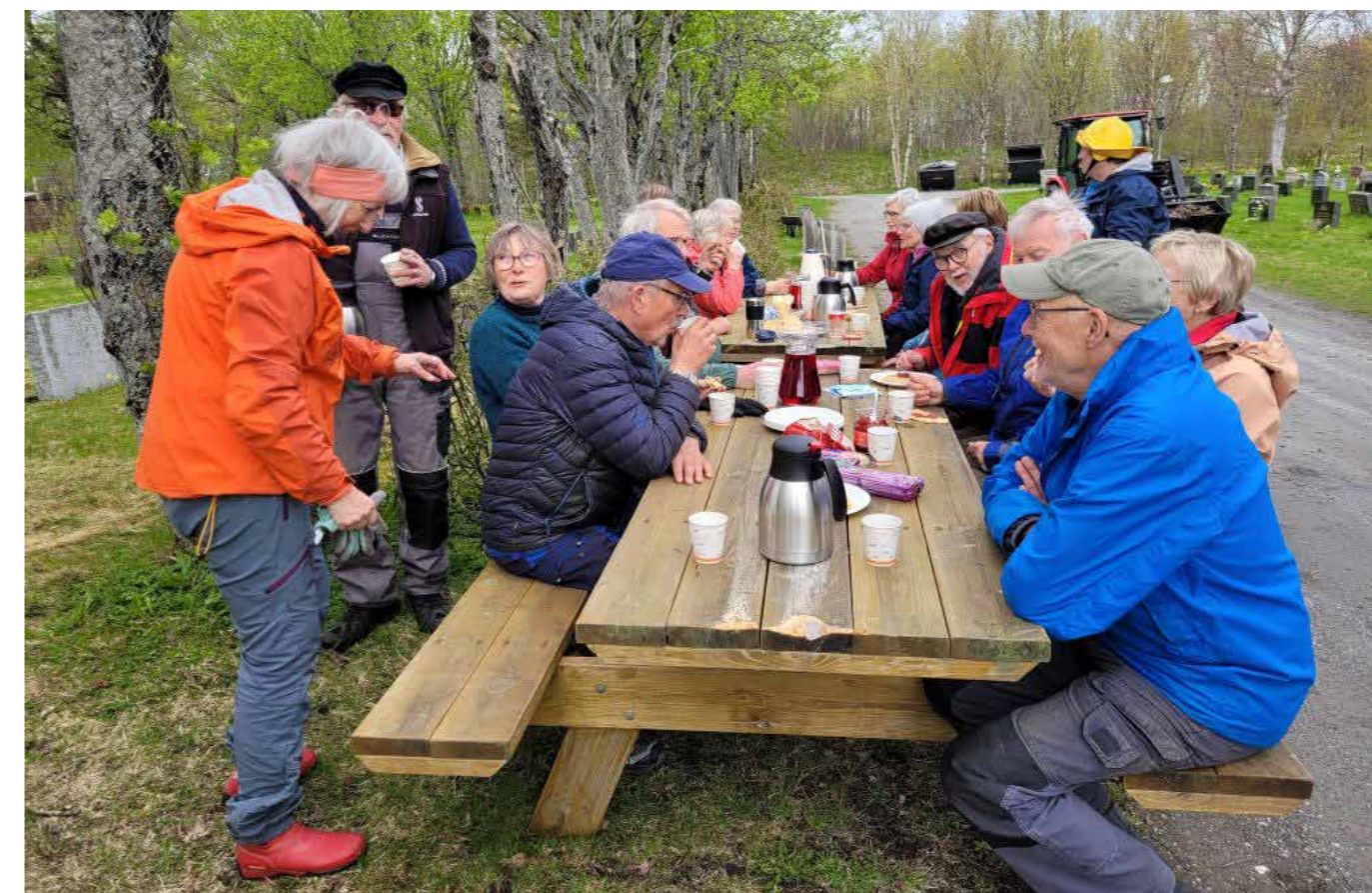
Kaffe og god prat Saltstraumen kirkegård