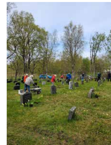
Dugnadsgjeng i sola, Seivåg Kirkegård