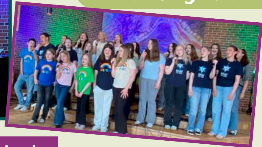
Felleskor med Colours