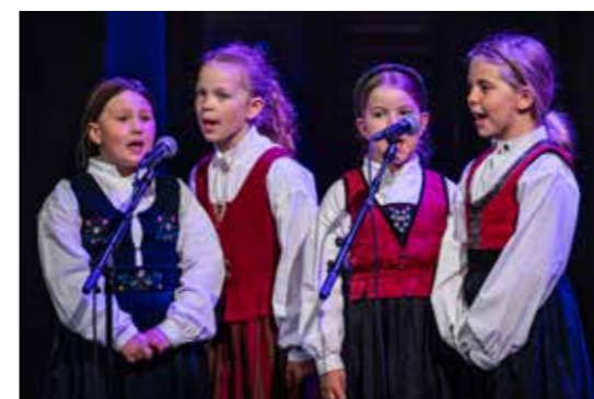
Fire glade sangere fra Saltstraumen Barnegospel på Sangskatten.