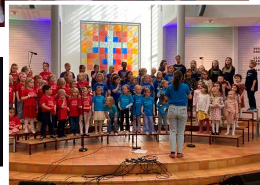
Barnegospelfestivalen i Rønvik april 2026.