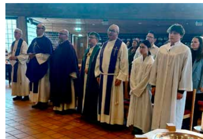
Medvirkende på gudstjenesten