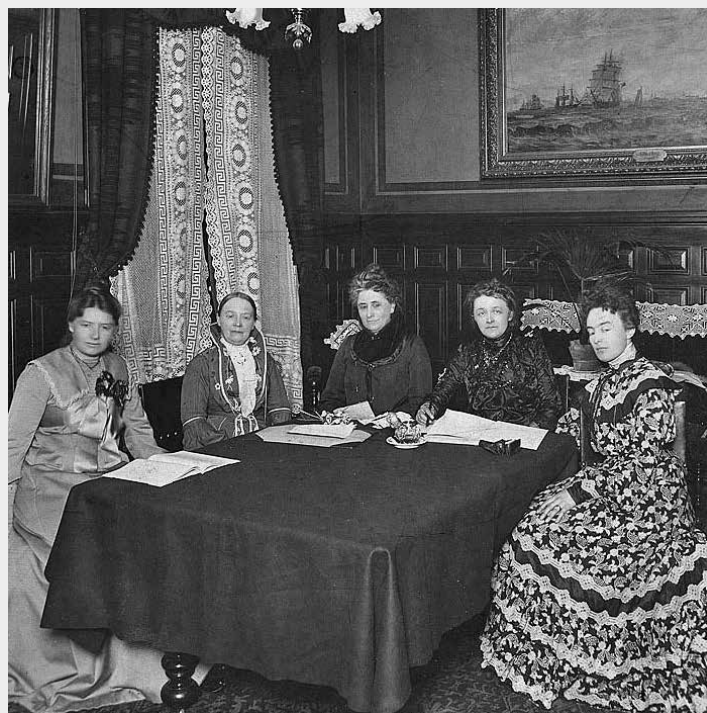
Kvinnens Nasjonalråd, stiftet i 1904. Første styremøte.

Kilder: Bl. a. Drammen – en norsk østlandsbys utviklingshistorie, Wikipedia, Norges offisielle statistikk – Stortingsvalget 1924, Adressebok Vestfold fylke og Drammen – ulike år.