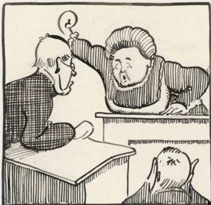
Betzy Kjelsberg. Karikatur