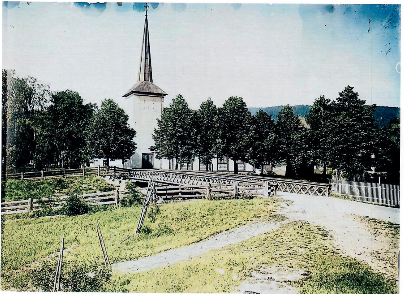
Gammelt bilde at Strømsgodset kirke med den gamle jernbanebru og med inngang for menn på sørsiden av tårnet. Kvinner hadde inngang på nordsiden av tårnet.